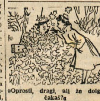
»Oprostite, dragi, ali že dolgo čakam?«

med katere spada tudi krepitev obrambnih sil, ni nobena žrtve prevelika. Taka obravnava velikih na račun malih narodov lahko prepriča samo enotno nastop vseh naprednih sil sveta, ki so pripravljene, če je potrebno, tudi z orožjem zaščititi neodvisnost malih pred vsako napadalnostjo imperialističnih sosedov.