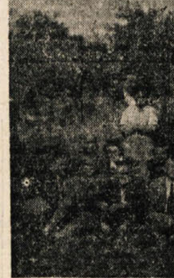
Z nepozabnega srečanja na Pugledu: skupina starih aktivistov iz Bele krajine

3. opustiti popravilo zgradb ali naprav, če ogrožajo varnost;