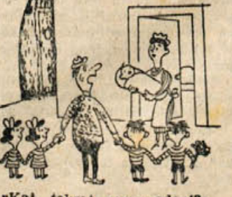
»Kaj, tokrat samo eden!?!«