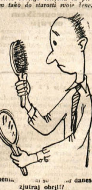
Smet... danes zjutraj obrij!!?

zato za pretežno večino nedostopno. Vsak poklic pa zahteva poleg osnovnošolske izobrazbe neko stopnjo strokovne izobrazbe in je ta tudi za vse poklice predpisana, samo za kmečko delo, za kmetijsko proizvodnjo še ni do sedaj nobenih predpisov in obveznem strokovnem šolstvu in strokovnem poklicnem spopolnjevanju. Ravno v tem vidimo kako močno je bil vaški človek zapostavljen v svojem strokovnem in splošnem izobrazevanju. Danes je stvar popolnoma drugačna. Mi želimo čim bolj izobraznega, čim bolj razgledanega in za aktivno sodelovanje čim bolj sposobnega kmeta, ki se ne bo pustil od zgoraj doli vladati in upravljati, temveč bo hotel sam sodelovati pri vsem, kjer se kroji tudi njegova bodočnost. (Nadaljevanje pride)