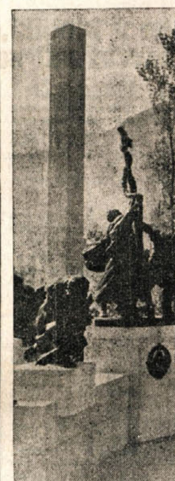
Podpredsednik Edvard Kardelj govori ob odkritju spomenika v Kočevju

zemlji. Zanimiva je bila tudi lovska razstava, a v obeh od delkih muzeja razstavljene zgodovinske predmete in dokumente so si mnogi ogledali celo dvakrat.