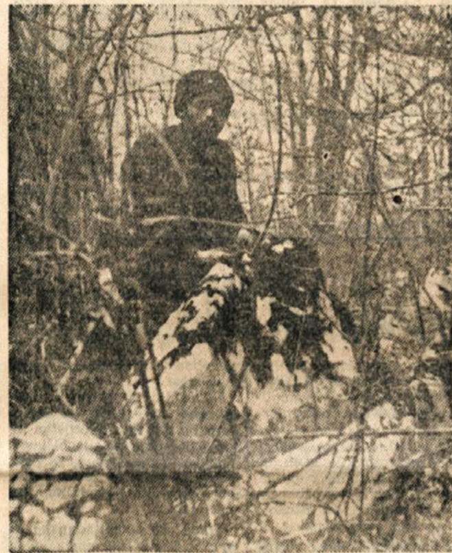
Partizan I. kočevskega voda v aprilu 1942

Kočevski zbor je izvolil obširen plenum OF, ki si je nadel tudi vlogo Slovenskega narodno osvobodilnega odbora, prvega predstavništva naroda, predhodnika kasnejše ljudske skupščine. Razen tega je bilo izvoljenih 40 predstavnikov za AVNOJ, katerega zasedanje se je vršilo dva meseca kasneje v Jajcu.