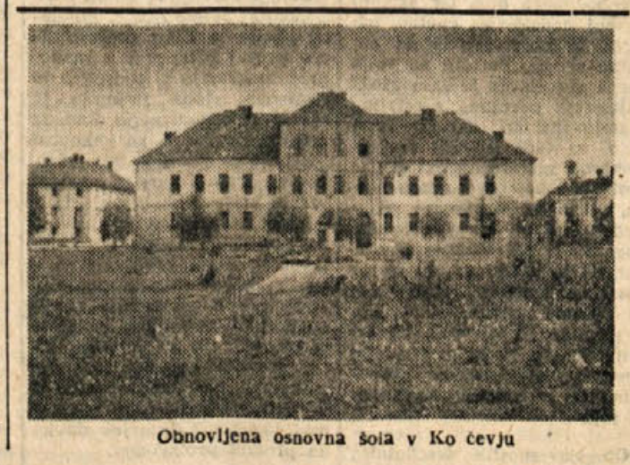
Obnovljena osnovna šola v Kočevju

razvoj družbenega življenja, je rekla na koncu svojega referata Vida Tomšič, predlaga izvršni odbor AFZ kongresu, naj se AFZ v sedanji obliki ohrani in edina ženska organizacija pri nas ukline. Žene se bodo vključile v razna žestojeca in nova društva in organizacije, ki se bodo pečale za vprašanih družbenega razvoja žena, jim pomagale kot materam in gospodinjam ter jim na ta način omogočale, da se bolj uveljavijo v družbenem življenju. Takšna društva in organizacije bodo od okraja navzgor povezane z Zvezo ženskih organizacij. V političnem delu pa bo skupno delo žena tesno povezano in enakopravno moškemu delu na tem področju. Cimbolj bodo žene delavne na družbeno - kulturnem, prosvetnem, sindikalnem, zdravstvenem in vseh drugih področjih, toliko hitreje se bodo dvignile na družbeno raven moških, kakor je v svojem pozdravu na kongresu dejal Milovan Djilas.