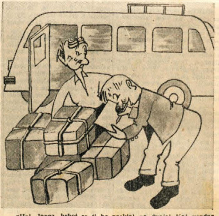
»Hej, Janez, hrbet se ti bo prekal na dvoje! Kaj vendar uganiaš s tistim krcaom in škrtičem v roki?« »Ja, naslovov si bom napisala!« »Kaj ti pa neki bodo, ko nimaš nikogar v Ameriki?« »Reveč sem in krščanski človek, ljudje pa vsi bratje med seboj: morda mi pa le pošljejo kakšen paket.«

Nad tem naj se zamislijo množične organizacije, predvsem pa starši, ki morajo vedeti za po-