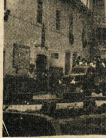
Iz vseh predelov Bele krajine so se na kamionih pripeljali mladinci in mladinke na proslavo desetletnice Pokrajinskega komiteja SKOJ v Črnomelj.

Kakor bi se spet sprehajali tod vsi, ki jim je dal Črnomej nekoč