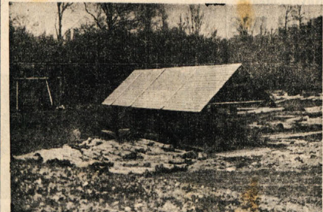
Nakladalna postaja žilnice pri Krvavem kamnu na Gorjancih

ta iz ene gozdne uprave sestavlja hkrati tudi upravni odbor gozdne uprave, vsaka uprava pa je zastopana vsaj po enem članu v upravnem odboru podjetja. Upravni odbori na posameznih gozdnih upravah sestavljajo dol-