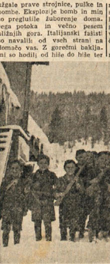
Pionirski odred v Podpreski na Kočevskem — pozimi 1944