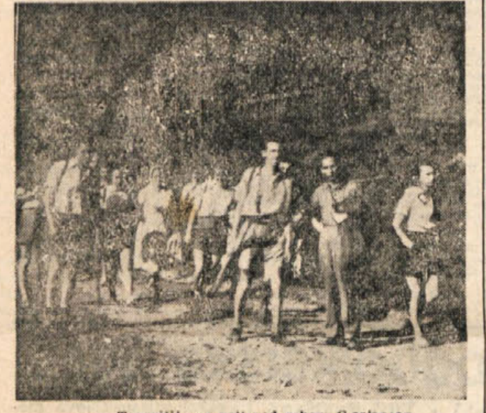
Tovarišija na poti pod vrhom Gorjancev

Za nastanek današnje oblike zemeljskega površja so bile od