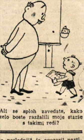
Ali se sploh zavedate, kako zelo boste razžalili moje starše s takimi reči?

Ta noč je bila prva in zadnja, ki sta jo Vinko in Jacek prebila med partizani. V zavetju gozdov, ob budnem čuvanju partizanske stražarja in skokovanju sove, ki se je jezila nad ugašajočim ognjem, sta se zleknila ob Taborski steni. Zjutraj ju je zbudil partizan in ju povabil k zajtrku. Najdla sta se zabeljenih žganec in se posladkala z medom, ki so ga partizani prinesli od goteniške strani. »Rešila sva si življenje in ostala bova pri partizanih, je predlagal Jacek. Ko sta gledala v dolino, sta mislila na svoje drage starše, pionirje in sosedo ter se enkrat v duhu držal v roki kos satovja, iz katerega je potekel curek medu in se mešal z mladjo, nedolžno krvjo kot grenka solza matere, ki je bila medtem že da-leč od njega na poti v taborišče smrti, od koder se nikdar pionirjema niso prizanesli. S puškinimi kopiti so ju pobili. Ko je umiral, se je Jaku iztrgal iz prs čuden krik groze