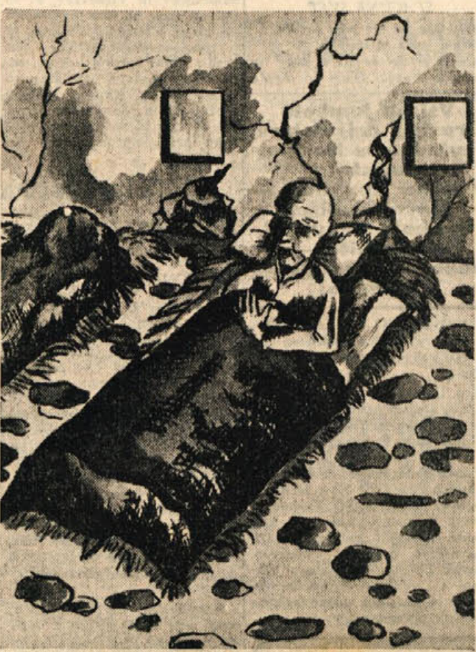
UMIRANJE NA RABU (orig. r. S. Hotka)