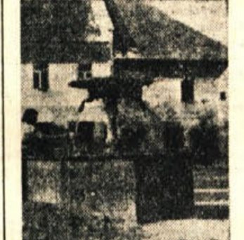
Ob žužemberškem vodnjaku

pisarno in matični urad, tako da bo prihranila letno lepe vsote na najemnine.