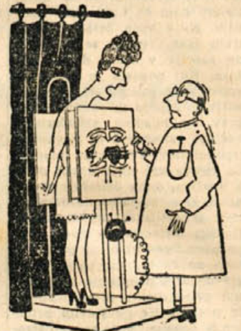
— Močno razirjeno srce imate. — Prosim, pošljite sliko mojemu možu, ki trdi, da sploh nimam srca.