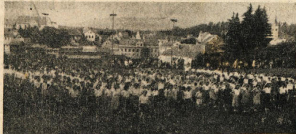
Z okrožnega zleta Partizanov v Novem mestu

600 milijonov din. Za to vsoto bi zgradili najmanj 300 novih družinskih stanovanj v enem letu! Stanovnjske krize bi bilo kaj kmalu konec. Med redkimi predmeti, za katere smo v letošnjih prvih treh mesecih izdali več kot v zadnjih treh mesecih lanskega leta smo izdali za tobak okrog 10 in pol milijona dinarjev več kot za sladkor, ali 52 din mesečno na prebivalca več za sbožjo travco kot za tako važno hrano kot je sladkor. Pomislimo, koliko je kadilec in koliko je potrošnik sladkorja in kaj pomeni za človeško telo eno in kaj drugo? Izdatki za tobak in alkoholne pijače, ki nikakor niso previsoke, navajajo, da izdamo vsak mesec okrog 50 milijonov dinarjev za ta dva predmeta. Na leto dobimo samo v novomeškem okraju kaj čedno vsoto: