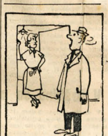
»Up... draga, up... prišel sem večerjat... up, kako to, up... da si še pokonci?... up...«

Vodstvu in učiteljskemu zboru šole gre vsa pohvala za trud in prizadevanje, da bi dosegli z učenci čim večje uspehe. Produkcija je pa spet pokazala v polni meri, da je glasbena šola v Novem mestu za razvoj glasbe izredno pomembna. Pribiti je treba, da se sedaj nastopajo nekateri učenci Glasbene šole v orkestru SKUD »Dusan Jerbe«, kjer so se izkazali kot zelo uporabne moči.