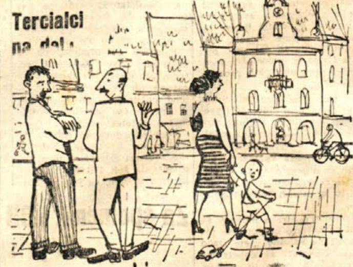
Ti, poglej jo, spet ima nove če vije in drugačno frizuro — ali je ne bi izklučili iz organizacij je?!

Poravnana naročnina vam jamči brezplačno nezgodno zavarovanje!