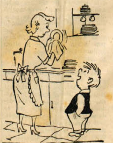
Po kosilu: »Mama lačen...«

izmed nas klonila. Prepričana sem, da je večini izmed nas boljše kot njej, pa smo vendar dosti bolj živčne, mnogo redkeje nasmejane in mnogo manj srečne!