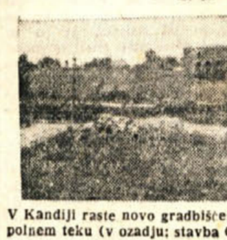
V Kandiji raste novo gradbišče: zemeljska dela za mlekarico so v polnem teku (v ozadju: stavba Gozdnega gospodarstva na Grmu)

priznan v I. razred, se bo odkupil po dnevni ceni, kot nagrada pa se plača še 50% od dnevne cene. Na približno isti način se bodo odkupovali tudi viški drugih priznanih semen.