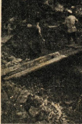
Vode bo dvojnó! V novem zajetju je pri-tebe na dan nad 250 sekundnih litrov, zdaj pa dobiva Novo mesto le 20 sekundnih litrov po starih cevih

Lanska izredna suša je poka-zala vso skromnost dosedanjega zajetja mestnega vodovoda. Hra-velredna naloga nove Ljudske-ga odbora mestne občine, ki si je postavil za svojo prvo dolžnost generalno obnovo in razširitev vodovoda, se je začela uresničevati letos v februarju. Poudarimo