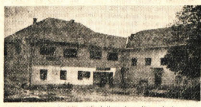
Prodnos dragatuških zadrugnikov je velik zadruga, dom

živinorejske, kreditni, strojni in druge odseke. Skratka, kar zadrugnik potrebuje, pa če je to vsakdanja potrebščina, orodje, sadike, seme, stroji, karkoli za gospodarsko poslovanje ali stanovanjsko hišo, za vse se lahko obrne na odgovarjajoč odsek svoje kmet. Pravi tako lahko vse svoje presežke obnovi preko zadruge. Splošni obrtni odsek ima izdelarje, tesarje, mizarje, kovače, kolarje in čevljarje.