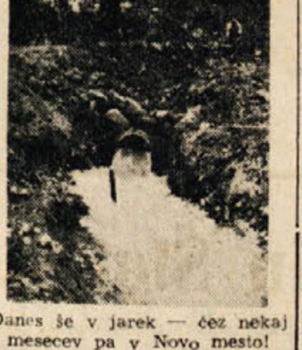
Danes je v jarek - čez nekaj mesecev pa v Novo mesto!

»Kdaj bo vse to gotovo?« smo vprašali z bralci vred.