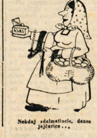
Nekdaj s admetičnic, danes jajčarice...

Iz skoraj vseh krajev Dolenjske prihajajo poročila o veliki škodi, ki sta jo povzročila leden mraz in pozeha 11. in 12. maja. Posebno občutna je škoda v Semču, kjer so najbolj prizadeti vinogradi, orehi, sadno drevje, pa tudi poljski prideški.