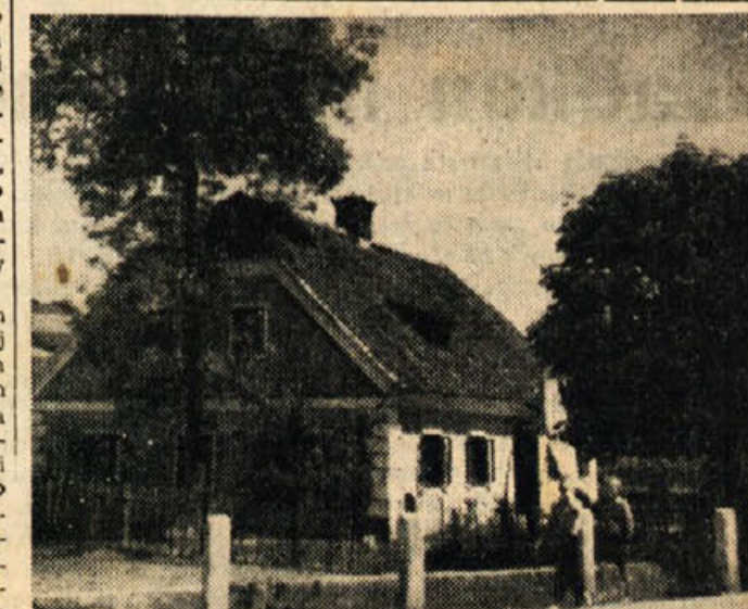
KUMROVEC — rojstna hiša maršala Tita v hrvaškem Zagorju