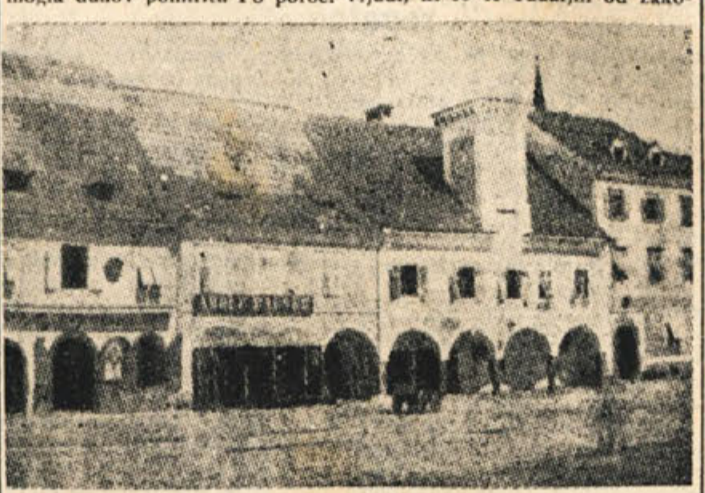
STARI NOVOMEŠKI ROTOVŽ (na sosodnjih hišah so še vidni sledovi arkad)

»Urudniki stare avstrijske uprave, ki so jih Francozi prevzeli in »potujejo po deželi na vse strani in ščuvajo k upor« — pa so aktivisti avstrijske vlade, ki upornikom skrivaj poročila, da je Francozov le malo in da se bo skoro vrnila avstrijska cesarska vojska.