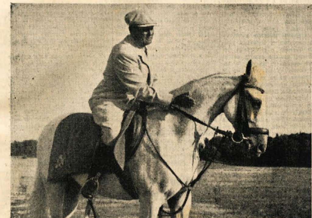
Naj živi in nas vodi še mnogo let naš preljubljeni tovariš Tito!

»Pričakujemo pomoč! Pomoč strokovno usposobljenih kadrov, da se bomo našega dela lotili uspešno, odklenjamo pa vsako možnost! S tem gestom na del, za boljšo bodočnost!«