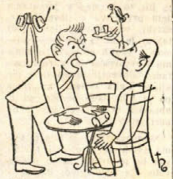
Kar ste vi, sem jaz že dolgo, vi norec domišljav!

»Dobre knjige in časopisi hiši vedno koristijo!«. Naročil se je za »Obzornike, revijo Prešernove družbe, poleg njega pa je v Gotni vasi že 11 članov družbe.