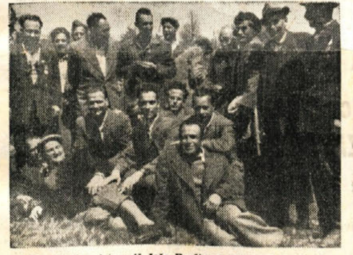
Narodni heroj tovariš Jože Borštnar med borci Gorjanskega bataljona