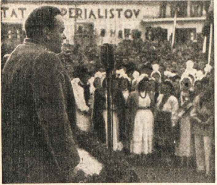
Tovariš Kidrič govori spomladani leta 1945 v Crnojliju

Ob ofenzivi 8. oktobra 1942 sem bil službeno poklican k njemu. Nahajal se je na Crmošnjicah.