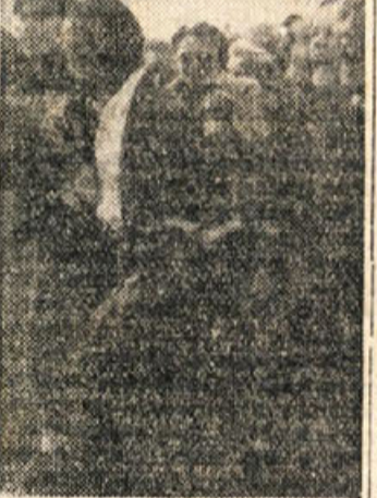
Kdo ne bi navijal za domači!

videti usodo Novomeščanov zapeteno. Tedaj je nastopila domača publika, ki je z glasnim navijanjem pozivila domačo vrsto, ki je pričela zopet v redu delovati. Nezadržani fini nosi doleteli.