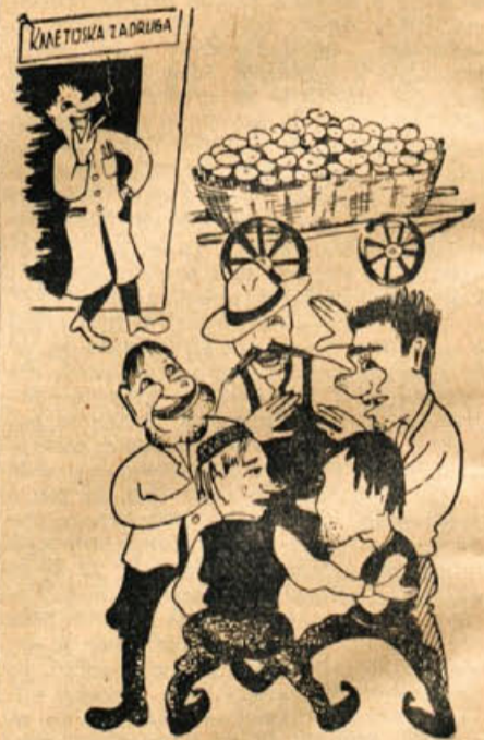
Kmet: »Po 18 din bi ga prodal...« Zdrženci prekupčevalci: »Kaj? Po 22 — ne — po 26, — po 30, — po 34 din ti ga plačamo!!«

Tako je tudi s koruzo; spekulanti izrabljajo nebudnost in se okoriščajo na tuj račun. Zameriti pa moramo nekaterim kmetijskim zadrugam, ki se ne zanimajo za odkup kmetijskih pridelkov in celo odklanjajo ponudbe. Če jih pa vzamejo, pa zahtevajo od kmeta, da zakupi v njihovi trgovini celotni znesek! Kupnine jim ne izplačajo, kar ustvarja vsekakor nerazpoloženje med kmetovalci. Izgleda, da igra pri nekaterih zadržih prvenstveno vlogo »stacuna«, odkup pa jim je postranska stvar. Vsekakor bi bilo priporočljivo, da bi tudi pri odkupu imele zadruge konkurenco. Danes, ko zadruge same brezkonkurenčno nastopajo pri odkupu, ljudje nimajo