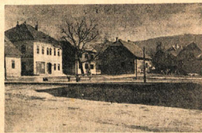
Pogled na trg v Sentjerneju, kjer bodo postavili spomenik žrtvam iz NOV

skem prazniku pa ne smemo pozabiti tistih, ki jim ni dano, da bi se z nami radovali, tistih, ki spijo pod rušo, ki so padli za naše življenje. Zato bo šolska mladina uredila grobove borcem in talcem in jih oktila s pomladanskim cvetjem.