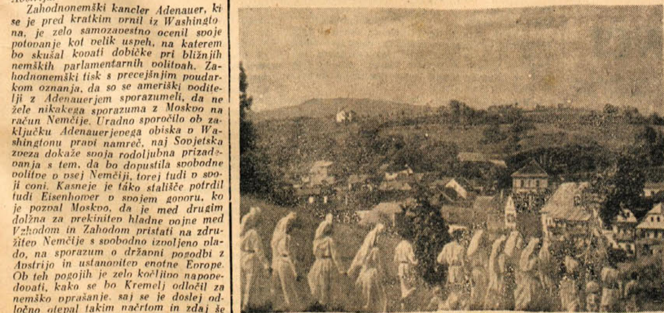
Zelena Jurija vodijo v Metliko (Iz filma »Pomlad v Beli krajini«)

za čas od 23. aprila do 3. maja Do konca tedna bo lepo vreme. V začetku prihodnjega tedna eden ali dva deževna dneva, nato do konca meseca lepo vreme. V prvih dneh maja nestalo s pogostimi padavinami.