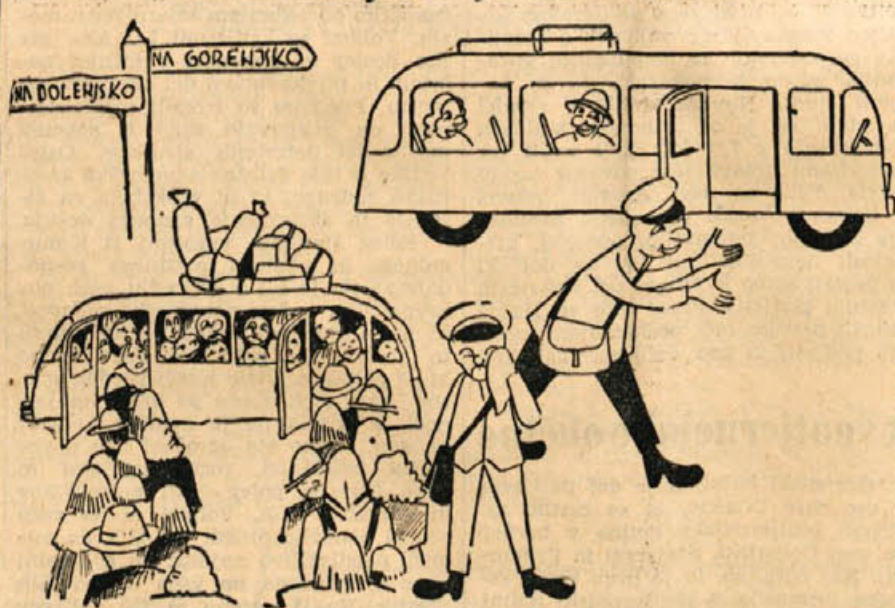
Vsakdanja slika na ljubljanskem avtobusnem postajališču