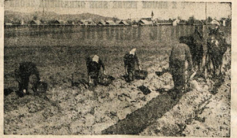
Le z dobrim semenskim krompirjem je zagotovljen dober pridelek