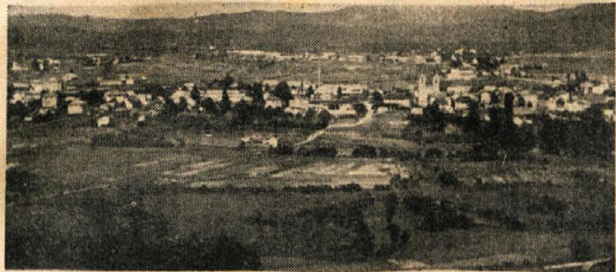
Pogled na Kočevje

Osvobodilne fronte in Izvršnega sveta LRS, da bo v oktobru letos prirejena ta slavnostna proslava desete obletnice Kočevskega zbora.