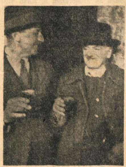
Dva zadovoljna Podgorca

Kmet se je boril le toliko časa, da je uklonil svojega graščaka in zadavil njegovega stokrat prekletega valpta, potem mu ni bilo nič več mar. Tudi neenak družbeni ustroj našega kmeta je mnogo pripomogel h končnemu neuspehu tako sijajno pričetu in izpeljane osvobodilne akcije. Bili so tedaj po va-