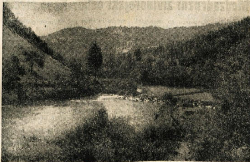
Dolina Kolpe pri Kostelu

Vse prizadevanje zdravstvenega kadra gre za tem, da delovnega človeka čimprej vrne produkciji. Veliko število oskrbovancev kaže tudi, da se naši ljudje vedno bolj pogosto zatekajo v zdravstvene ustanove po zdravniško pomoč, saj je bilo povprečno dnevno v oddelkih 242 bolnikov, 2 do 3 porodi, 16 operacij in 29 ambulantnih storitev. Povprečna oskrbnina (doba zdravljenja) 10 dni je v mednarodnem merilu zelo