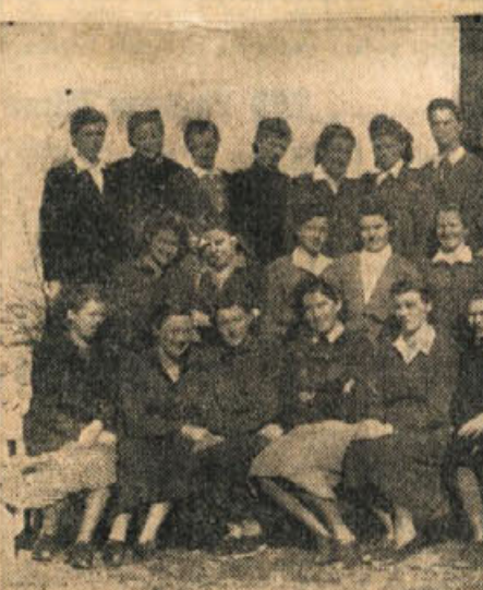
Te dni so bili na Vinici in v njeni okolici zaključeni kar štirje tečaji. V Hrastu so priredile tečajnice lep družabni večer, na Vinici pa so imele razstavo del prikrjovalnega in vezilnega tečaja. Poslovilni oz. zaključni večer gospodarskega tečaja so priredili tudi dekleta in žene na Vinici. Razgibano izvenšolsko izobraževalno delo je v tej zimi doseglo na Vinici lepe uspehe, za kar gre zasluga postrvovalnim tovariščam in prosvetnim delavcem, ki so tečaje pripravili in dobro vodili.