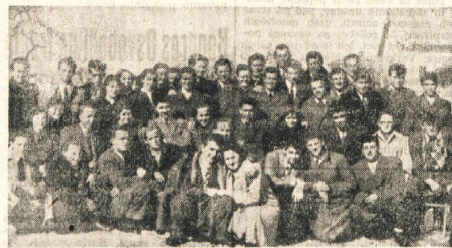
Mladina okraja Kočevje je dostojno počastila pravkar zaključen V. kongres LMJ. Na občinski konferenci je v vsem okraju pregledala svoje dosedanje delo, navedla vrste organizacij in poskrbela za poglobljeno politično-ekonomsko delo med mladino. Nad 300 mladincev je bilo pred kongresom LMJ sprejetih v organizacijo, ki je pripravljena izvršiti vse sklepe, ki so jih sprejeli delegati preteklih dni v Beogradu.

Ostale manjše — predvsem slovnične napake je bralec gotovo lahko sam opazil.