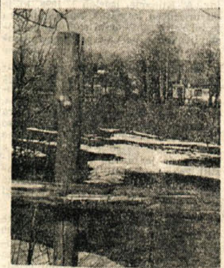
Pomlad je pred pragom — zadnje krpe snega pa še kar ne morejo s travnikov in bregov, čeprav smo dobre štiri mesece prenašali zimo