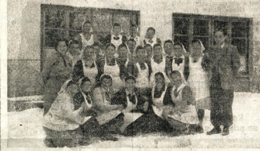
V nedeljo bodo zaključili splošno izobraževalni tečaj tudi v Gabrju na Gorjančih

Pododbor rezervnih oficirjev, ki obsega občinski LO Gotna vas in Brusnice, je imel svoj letni občni zbor.