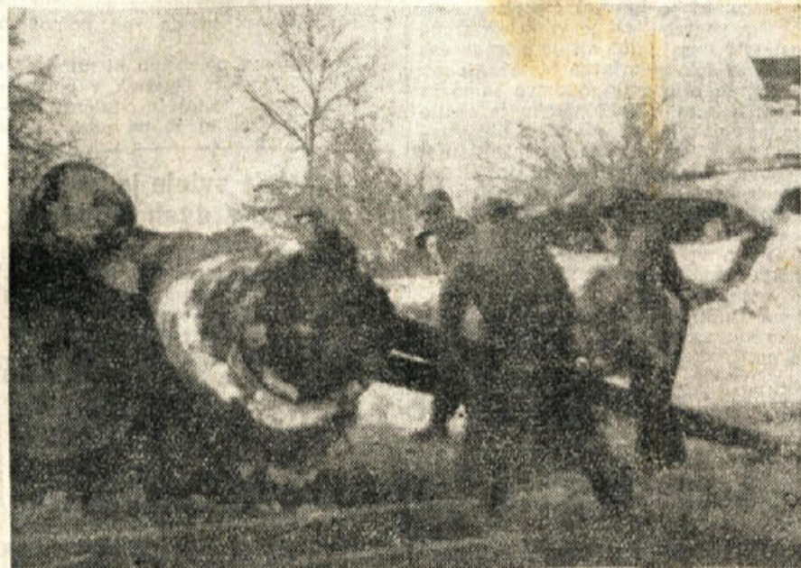
Tudi v zadnjem visokem snegu so imeli LIP-ovi nakladalci pod gabrsko žičnico polne roke dela. Poleg Roga so Gorjanci najvažnejši dobavitelj surovin za našo lesno industrijo