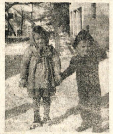
V dolini je že skoraj pomladansko razpoloženje, bratec in sestrica v Gabrju na Gorjancih pa se še lahko kepa...

Sedaj so vsa gasilska društva organizirano pričela razpečavati srečke, da pospešijo zaključek in lahko razpišejo zbranje. Nikogar naj ne moti datum na srečkah, ker je bila loterija prestavljena zaradi tehničnih ovir in bodo izzbrane številke takoj po zbranju objavljene v časopisu in po radiu. — Cena srečki je 30 dinarjev. — Segajte pridno po srečkah in podprite naše gasilstvo!