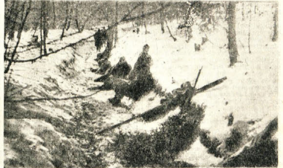
Iz borb v Suhli krajini pozimi leta 1945

Nemogoče je v kratkem uvodniku podati točno sliko in vso veličino he-