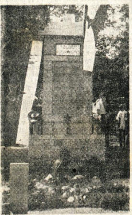
Spomenik žrtvam NOB pri Roku nad Šmilhelmom