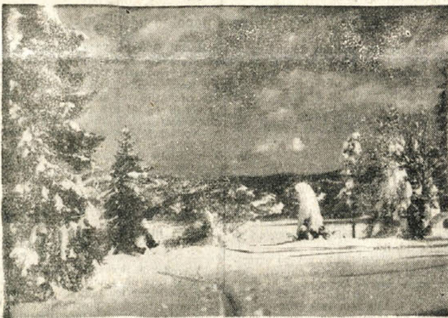
Zgodnja zima nas je obiskala — že od 3. decembra dalje na Dolenjskem vsak dan po malem sneži ...

za čas od 11. do 21. decembra Mraz s pogostimi snežnimi padavinami; po 13. decembru otrejši mraz.