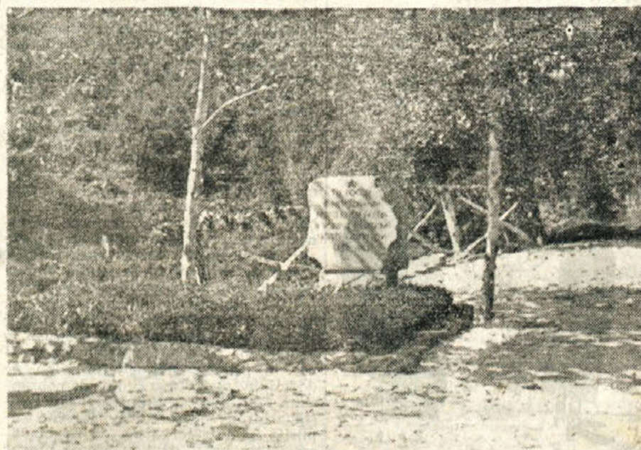
»Tu počiva 6 nepoznanih partizanov, padlih v borbi z nemškimi fašisti v ofenzivi l. 1943 — nam govori kamen na Prati nad Ubim, zadnjim domovanjem junakov velike domovinske vojne. Takih spomenikov je polna vsa domovina. Za nas so padli, na vrtilih stražah so in bodo ostali za vedno, sredi nas živi spomin na herojski lik neznanega partizana

Tudi Novomeščani so za svoje kandidate izbrali vrsto predatih in požrtvovalnih, že do sedaj znanih tova-