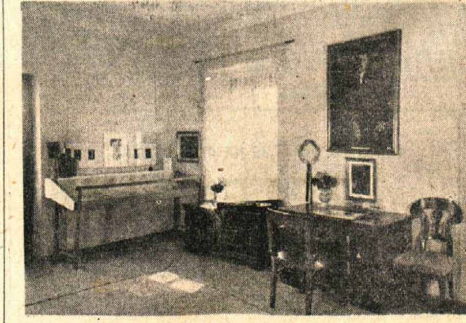
Soba Mirana Jarca s pesnikovo pisalno mizo in violino. V vtrini rokopisni in knjige, na steni portret pesnika in ilustracije njegovih knjig, dela B. Jakca

Za razstavljeno gradivo je bil Dolenjski muzej, kot povedano, navezan v prvi vrsti na pomoč MNO LRS, ki je dal na razpolago svojo zbirko, partizanske grafike, Umetniške