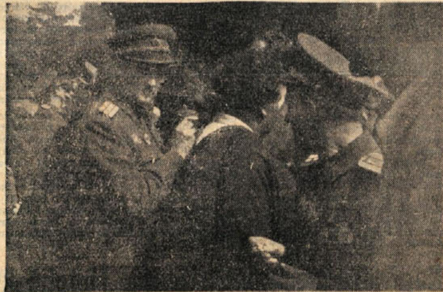
Kakor v partizanih, je tudi v Toplicah tovarišev hrbet služil namesto mlze. Prvoborci izpolnjujejo kartone s podatki o vstopu v naše prve brigade.

»...Svet danes že pozna našo državo, spoznal je duha, ki preveva naše ljudi, ve, da je to ponosen narod, da je ta narod strašno trpel, da je prenesel nadčloveške napore. Danes imamo mnogo prijateljev na svetu. Prizadevali si bomo, da teh prijateljev nikoli ne iz-