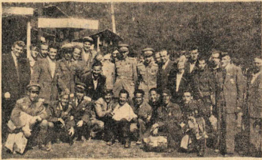
»Za spomin!« — Stari Cankarjevi so dobre volje ob bregu Sušice.

Kvaliteti naših pridelkov bodo morale SKZ posvetiti vso pozornost, hkrati pa znižati ceno. Ze danes najdemo na zunanjih tržiščih istovrstne pridelke raznih držav, ki pa so mnogo cenejši od naših. Zakaj? Pri nas porabimo za popolno obdelavo 1 hektarja pšenice 250 do 300 ur, v Ameriki pa 15 ur in 13 minut. Francozi, na primer, porabijo za obdelavo 1 hektarja vinograda samo 60 do 80 ur, in to so vinogradi z večjo in boljše kvaliteto. Zato bodo morale Splošne kmetijske zadruge s svojimi strojnimi odseki in na druge načine boriti za povenitev proizvodnje, kar je v tesni zvezi z zmanjšanjem uporabe delovne sile na 1 hektar.