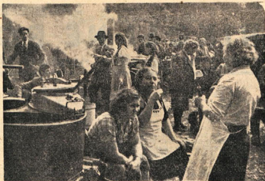
Skupina tabornikov pred obnovljenim partizanskim domom na Frati

Ne moremo si kaj, da ob tej priliki ne bi zapisali ugotovitve, da so bili naši časopisi v svojih kritikah po prvih predstavah »Kekca« kaj malo navdušeni nad novim proizvodom naše mlade filmske umetnosti. Kot po navadi je bila kritika za domače delo uničujoča, ali pa vsaj zelo, zelo skromna, čeprav ji za prenekatero tuje delo ne manjka slavospevov in visoko donečih besed. Menda je bil poleg mariborskega »Vestnika«, ki je po premieri natisnil ugodno in pozitivno oceno o »Kekcu«, le še »Dolenjski list« med tistimi redkimi časopisi, ki so povedali o »Kekcu« to, kar je čutila in čuti ob njem naša mladina — kateri je film tudi namenjen. Ponovimo besede našega sodelavca M.