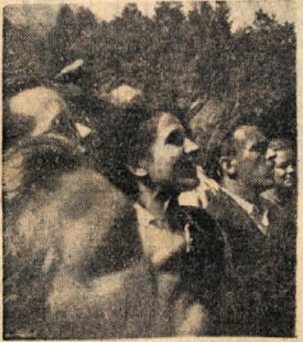
Pazljivo poslušajo — tovariš Tito govori...

so bili v srcu z nami, čeprav so morali ostati doma! V soboto proti večeru sem hitel čez Brezovo reber in Lipovec — vas je bila kakor izumrla. Pri neki hiši so devali prašiča iz kože. »Za praznik na ne sme nič manjkati!« je prabila mlada gospodinja in se široko na-