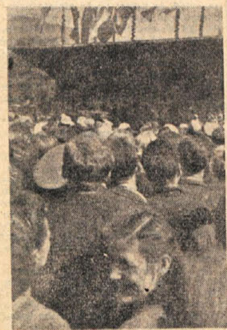
Pogled na slavnostno tribuno med govorom maršala Tita

Ureje uredniški odbor — Odgovorni urednik Tone Gosnik — Tiska tiskarna Ljudske pravice v Ljubljani — Naslov uredništva in uprave: Novo mesto Ljubljanska cesta 25 — Poštni predaj 23 — Telefon uredništva in uprave 127 — Tekoči račun pri Narodni banki v Novem mestu 41ev 616 1 90322-L. Cetrlistna nagradna 100 dno polletna 300 din, celoletna 600din.