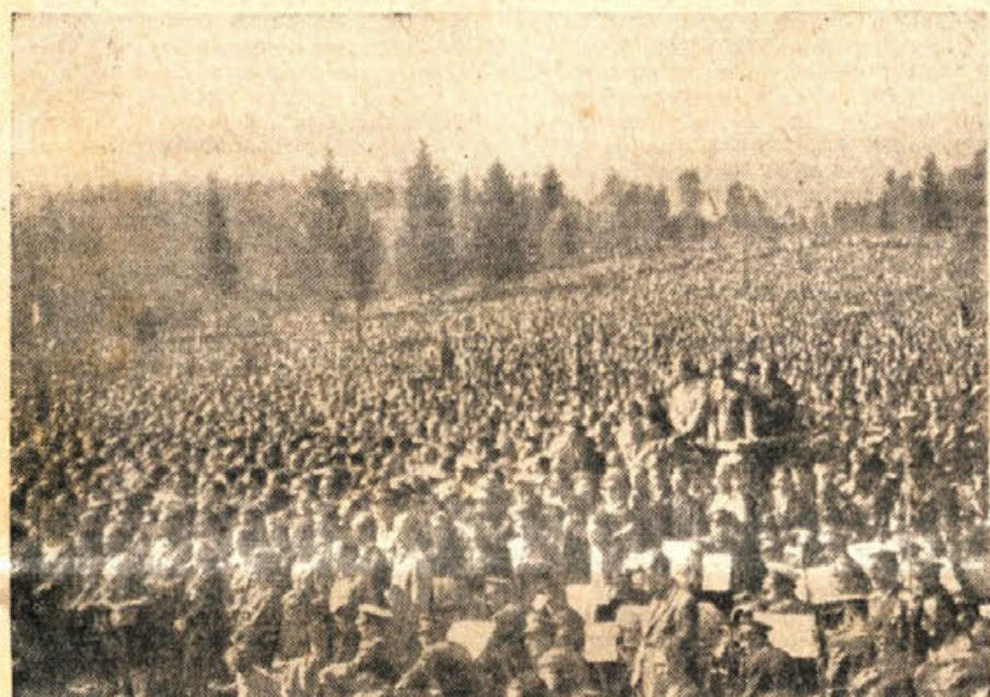
Godba JLA na slavnosti v Dolenjskih Toplicah