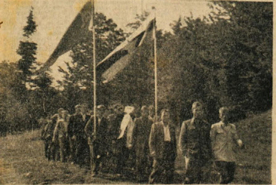
Mogočna četa z Dvora je prikorakala na Frato