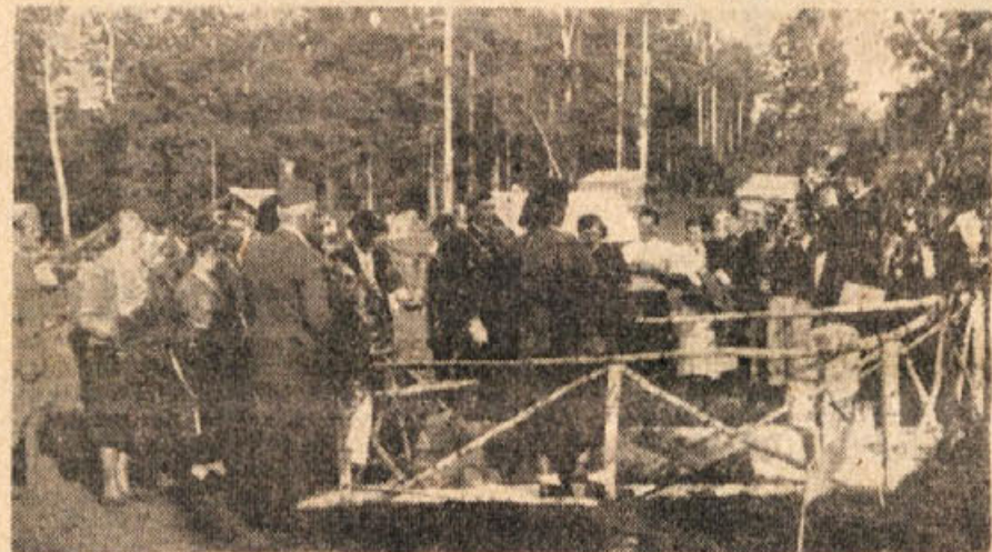
Na grobove padlih polagajo vence

da nismo imeli za materialno podlago nič drugega kot roke, visoko zavednost in voljo do dela, da bi ustvarili nekaj lepšega, kot je bilo, ustvarili socializem, — smo poleg gmotnih težav zadeli tudi na velikanske ovire, ki so nam jih delali od zunaj.