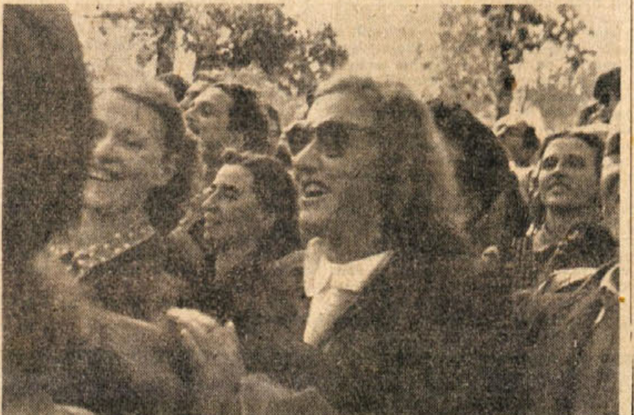
Navdušeno pritrdjevalo poslušalec maršalovim besedam

Zaenkrat jim vračamo v ogromni meri že s tem, da smo tu na tem ozemlju na Balkanu, geografsko in duhovno enotni, da imamo močno oboroženo armado in da stojimo kakor stena, ki brani tako sebe kakor Zahod, s čimer