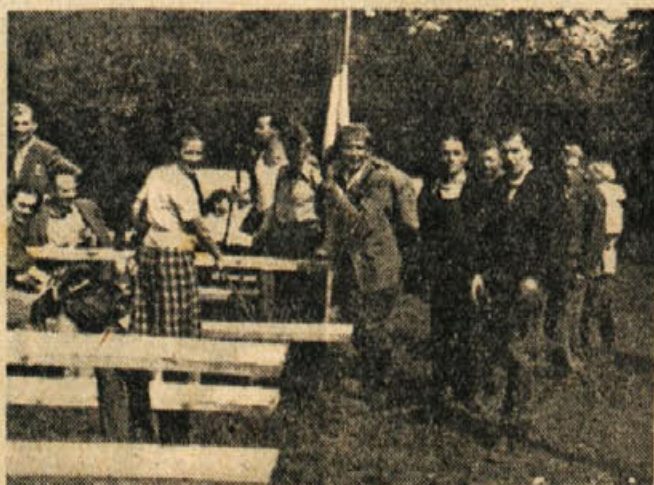
Priloh članov ZB iz Mokronoga

Za ta praznik je Novo mesto dobilo še drugo pomembno novost. Ulice in ceste so dobile nova imena. Hišnih tablic sicer še ni, je pa na vходу vsake ulice ali na začetku ceste napisna plošča z novim imenom.