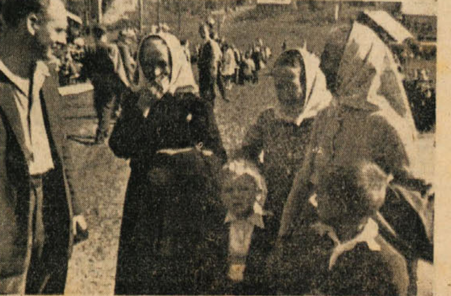
V prijetnih pogovorih znancev in prijateljev je čas hitro potekal