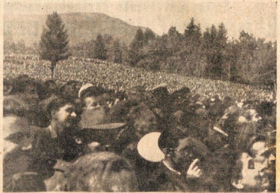
Pogled na del zborovalcev med govorom maršala Tita

Ne zahtevamo, da bi bila tam naša jugoslovanska uprava oziroma vsa oblast, prav tako pa ne dovolimo, da bi bila njihova. Naj ima Trst svojo oblast tistega naroda na svobodnem