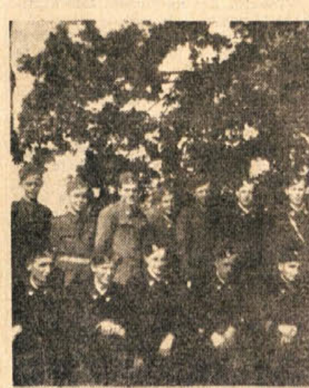
Dragatuški gasilci pozdravljajo Dolenjski list, ki je med njimi precej razširjen in ga vsi radi berejo

Gasilsko društvo v Dragatušu je bilo ustanovljeno leta 1911. Navzile prizadevanju posameznikov v letih pred vojno ni doseglo pravega razvoja. Vojna vihra družbu ni