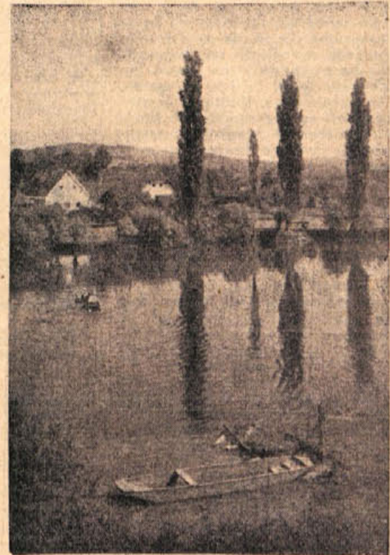
Lepa je dolenjska deželica — najlepša ob Krki

15., 16. ter 22. in 25. avg. bo lepo vreme, med 17. in 21. avg. nestalno s pogostimi padavinami, okrog 24. avg. ponoven dež.