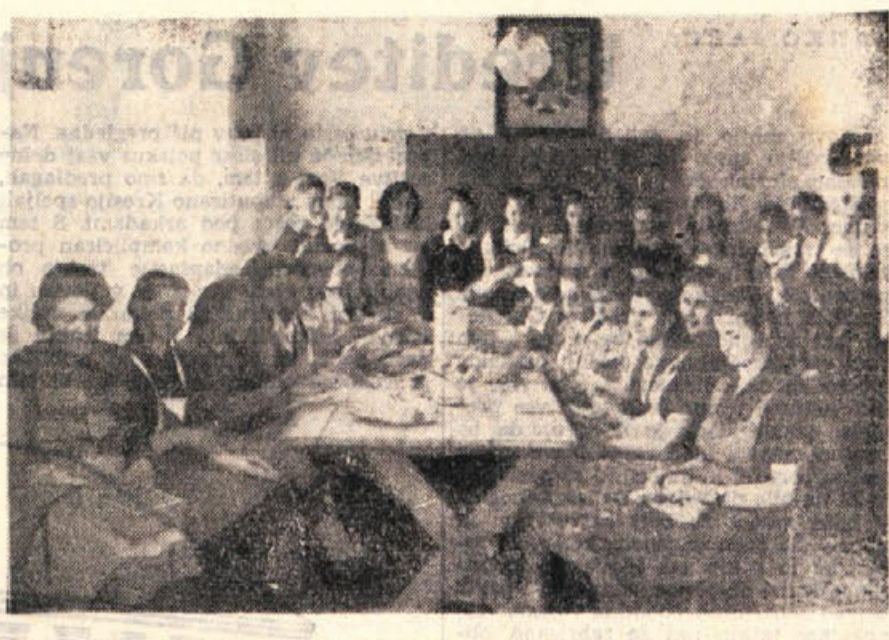
Udeleženke kmetijsko-gospodinjске tečaja v Vinomeru pri Metliki pozdravljajo bralce Dolenjskega lista.