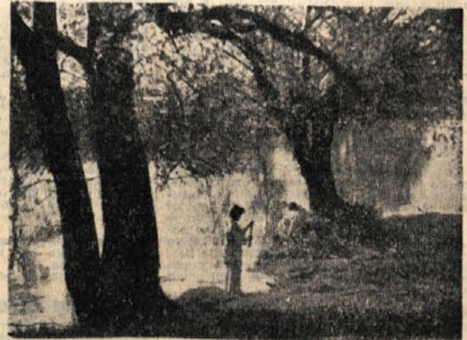
V pomislnem jutru ob Kolpi. (Prizor iz filma.)

»To, kar smo v Beli krajini posneli, je pri nas prvi slovenski dokumentarni film, ki bo imel originalno glasbo, originalno petje in obenem zvočne efekte. Glasbo je pripravil»