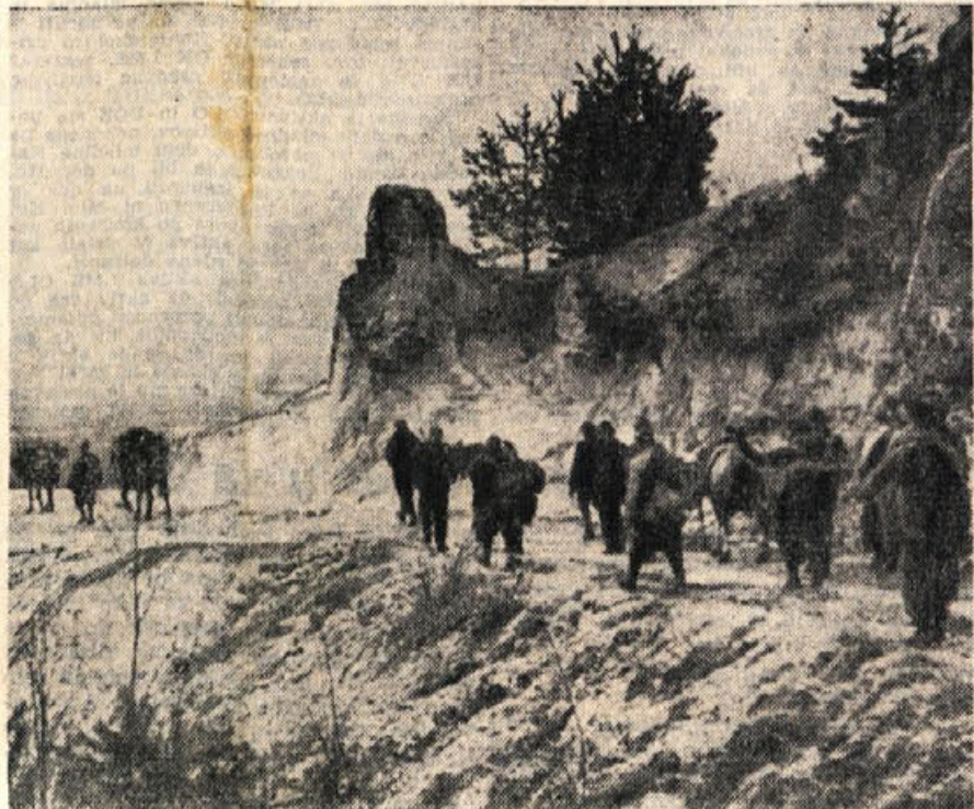
Tudi Tomšičevci se bodo zbrali ob velikem prazniku slovenskega partizanstva v Dol. Toplicah.

Iz Sentjerneja bo odšla patrolja že 16. julija na Trdinov vrh, kjer bo prevzela zastavo od Belokranjcev. Ob štiri zjutraj 17. julija bo šla s Trdinovega vrha mimo Gospodine v Gabrje, skozi Hrušico in Zabo vas v Novo mesto. Druga patrolja bo prevzela na Bučki zastavo od krške 16. julija zvečer in šla naslednji dan preko Skocjana, Zbur,