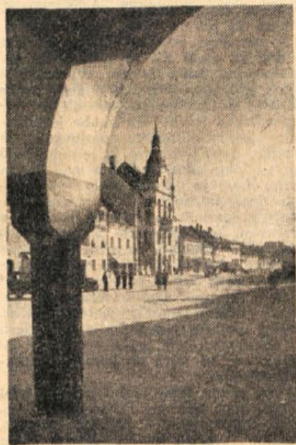
Novo mesto — pogled na Glavni trg

Enotnost in zavednost prebivalstva se je pokazala posebno ob dneh, katere je OF proglasila kot slovenske praznike kot na primer 29. oktobra (dan borbenega protesta proti naši sužnosti), dan 1. decembra (dan sloge in enotnosti narodov Jugoslavije), 3. januarja 1942 (dan spomina na padle žrtve). Te dni so bile novomeške ulice posute z narodnimi zastavicami in letaki OF, zidovi pa so bili popisani z znaki Osvobodilne fronte — Triglav s črkama OF in Partije — srp in ključ. Na Gorjancih je bila zažgana planinska koča, ki bi mogla okupatorju služiti kot postojanka, na Kapitlju pa baraka, v kateri so karabinjerji imeli shranjene avtomobile in bencin. Po direktivi OF so prebivalci Novega mesta v teh dneh demonstrativno izpraznili med 7. in 8. uro zvečer vse ulice in javne lokale, katere so potem napolnili po 8 uri zvečer. Za OF so bile te manifestacije propaganda za njen program in preizkušnja in dokaz slovenske narodne discipline. Okupator se je lahko prepiral, da nima oblasti v rokah in da slovenske ljudske množice izpolnjujejo zavestno odredbe OF kot edine od slovenskega ljudstva priznane oblasti. Zato so te dni okupatorske patrle križarile po mestu z orožjem v rokah. Ker pa je njihov strah naraščal, so odredili policijsko uro ob 7. uri zvečer (pozneje, 8. februarja 1942, pa celo ob 5. uri popoldne), uvedli so posebna dovoljenja za odhajanje iz mesta in v začetku februarja 1942 obdali mesto z žično ograjo.