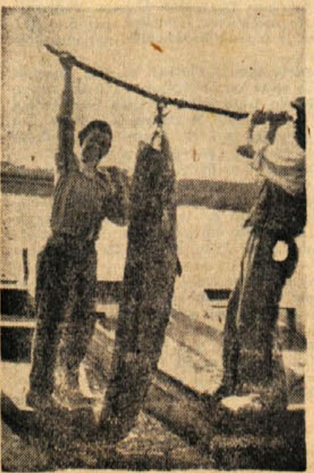
Zadovoljna ribiča s plenom

V metliški mestni mesariji si je potem velikega soma ogledalo mnoge mesčanov, zlasti pa je vzbudil pozornost pri šolskih otrocih.