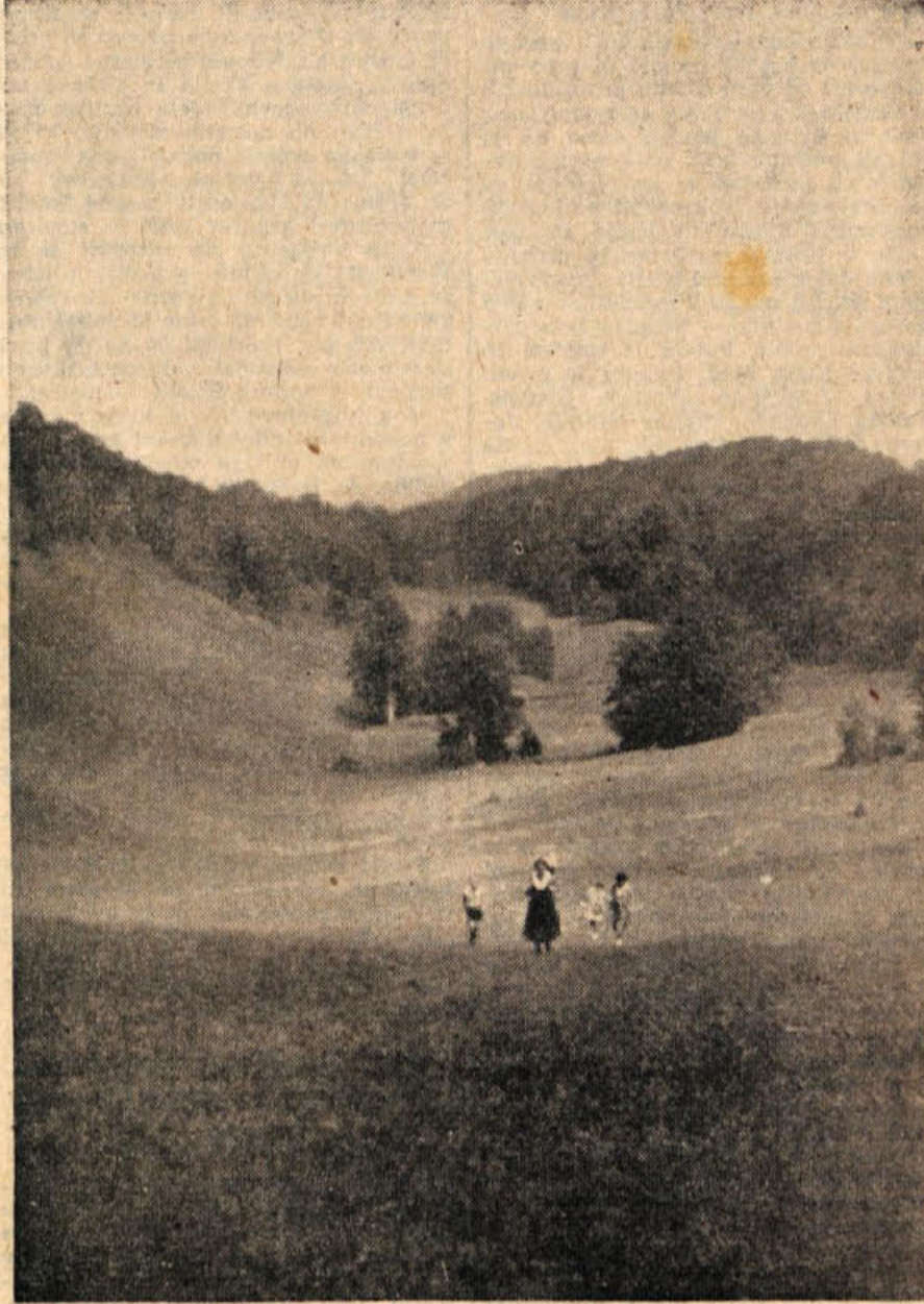
Gorjanske košenlee vabijo...

Ves njen postopek je bil tako surov in arogant, da je od razburjenja tri minute zatem neko dvajsetletno božastno dekle dobilo v čakalnici božastni napad, mnogo čakajočih bolnikov pa je rajši odšlo domov.