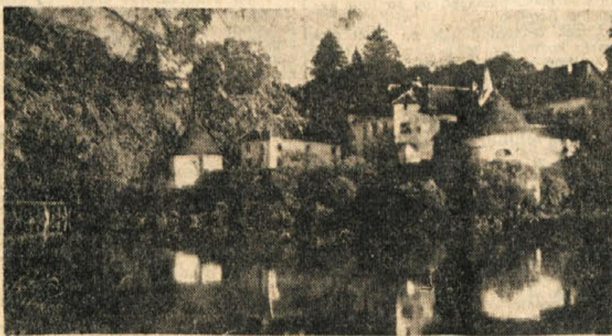
Grad Otočec pred zadnjo vojno

Staroslavne so šentjernejske konjske dirke. Treba bi jih bilo izenačiti s sorodnimi priznanimi ustanovami v Jugoslaviji in jih primerno popularizirati.