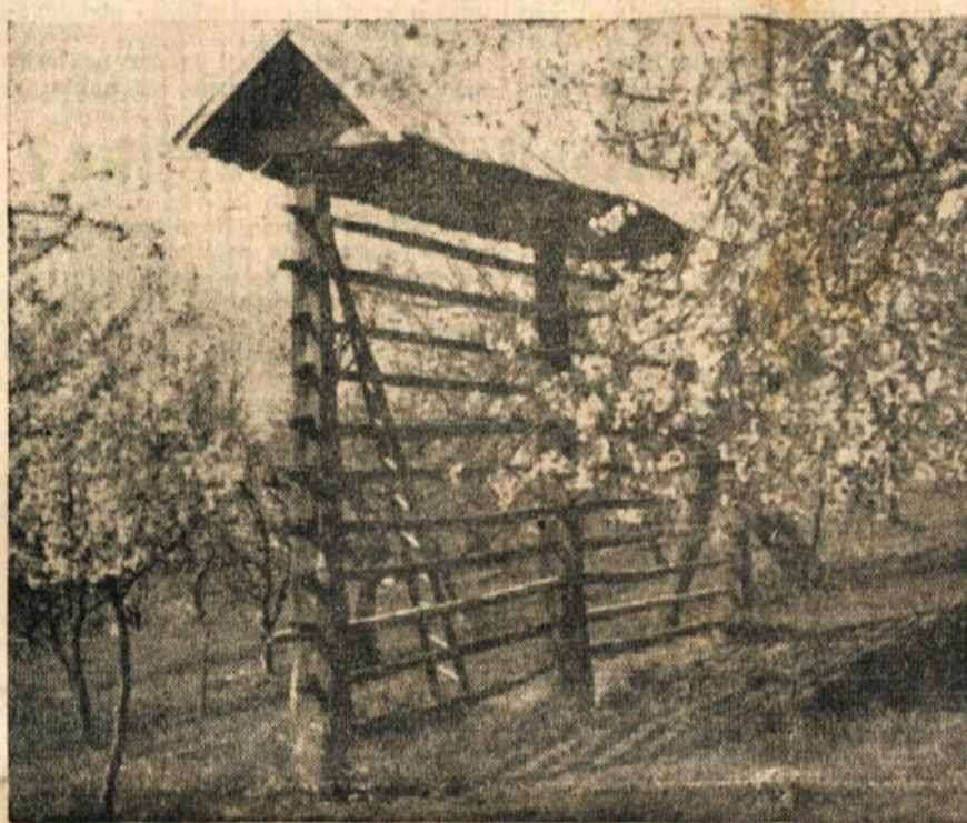
»Dolenjski list« čestita k prazniku dela vsem svojim bralcem!

Podpisane organizacije v Mirni peči in Karteljevem ostro obsojajo izzivanje fašističnih izzivačev in barantanje v Londonu, protestno resolucijo pa zaključujejo s pozivom: Zivljenje damo — Trsta ne damo!