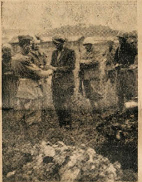
TO SO NAJOGARNEJSI DOKAZI 2000.LETNE RIMSKE KULTURE

Da so vojaki tak ukaz od Robottija in Orlando resnično prejeli in jim je bila obljuba enomesečnega dopusta naravnost vzpodbuda za streljanje na naše ljudi, dokazuje kazni, ki jo je vojak za to pismo dobil: 5. novembra