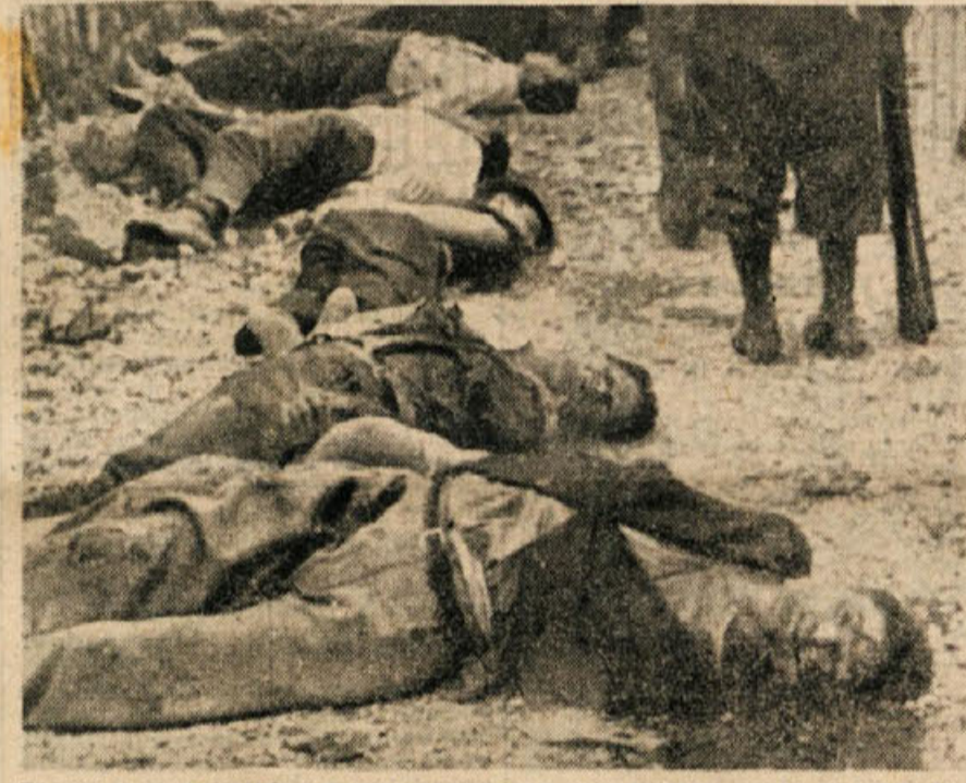
TAKO SE JE ZGODILO S TISOČI NEDOLŽNIH SLOVENSkih LJUDI SAMO ZATO, KER SO BILI SLOVENCi. VSI TI ŠTEVILNI GROBOVI DANES KLICEJO: NE POZABITE, KAJ JE FAŠIZEM!

V preteklem tednu je delavna mladina Št. Janza izvolila nov občinski komite LMS. Na konferenci se je zbralo nad 70 mladincev in mladink, ki so v živahnem razpravljanju ugotovili, da so svoje delo v zadnjem letu močno izpopolnili in vzbudili zanimanje za organizacijo pri velikem številu mladine. Zda pripravljajo za kulturno prireditelstvo imajo pevski zbor, na okrajnem festivalu pa bodo nastopili z lutkami, za katere je med njimi zelo veljavo nasušenja. Bodo povezave imajo z mladino sosednjega Dobrostanja, ki so gostovali v Št. Janzu z Jurčevim »Domnom«.