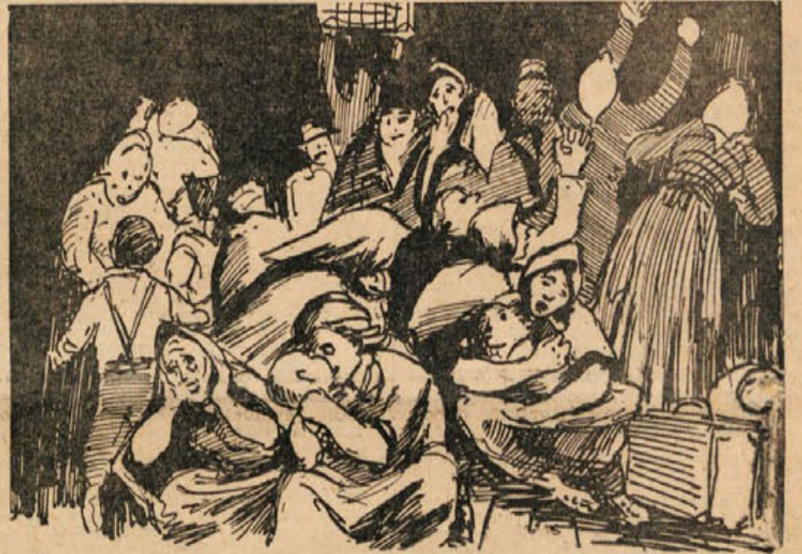
DESETTISOCI SO MORALI V ZAPORE IN TABORIŠČA, OD KODER SE MNOGI NISO VEČ VRNILI

Z blagom, ki ga še imam, ne vem kaj storiti, kajti čez nekaj dni bomo znova odšli na isti posel v kakšno drugo vas in to blago, ki ga imam, sem prisiljen prodati. Z njim ne morem niti teči, da bi se branil in mi je v veliko