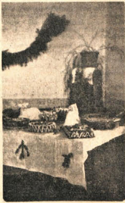
Z razstave gospodinskega tečaja v Kartaljevem