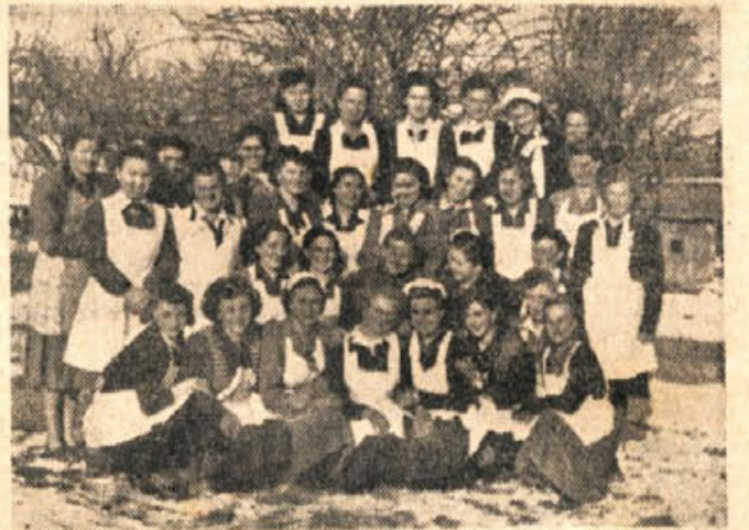
Zadovoljne tečajnice iz Šmilhela pri Novem mestu pozdravljajo bralce Dolenjskega lista

V glavnem so bili tudi vsi tečajji zaključeni v marcu, povsod skoraj z razstavo, ki je pokazala uspeh tečaja, in s kulturno prireditvijo. Za večino teh prireditev trdim, da je bil to obremen kulturni praznik.