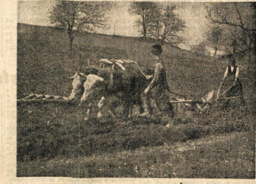
Na prisojalnih rebrih so že zoraali prve brazde

države. Tako je tudi sedaj v Ameriki. Mi smo dosledno prav v skladu z Ustavo pomagali cerkvi in verski skupnosti. Pomagali nismo samo katoliški cerkvi, marveč tudi drugim. Sedaj jih odvajamo od države, vendar pa cerkvi ne prepuščamo, da bi imela še nadalje svoje šole in fakultete. Naj jih le imajo. Hočemo načelno ločiti cerkev od države; naša Ustava nam ne daje pravice, da bi se tudi fakultete vzdruževale po državnem proračunu, saj je cerkev ločena od države. To so razumeli kot nekakšno poslabšanje odnosov, ni pa nič drugega kot naš kurz tudi o tem vprašanju. To so prvi v Ameriki, Franciji in drugih državah že zdavnaj storili in za vsakogar je tamkaj to normalno.«