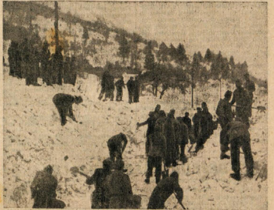
Pripadniki JLA so ogromno pomagali prizadetemu prebivalstvu. Na sliki vidimo skupno vojakov, ko čistijo ogromen plaz, ki se je vsul na cesto med Tolminom in Kobariždom

Kolektivni podjetji in ustanov, politične organizacije in posamezniki naj pošiljajo vse materialne prispevke neposredno Izvršnemu odboru OF v Tolminu, denarne prispevke pa na čekovni račun Izvršnega odbora OF Slovenije 601-95321-0 pri Narodni banki, kjer se ti prispevki zbirajo in bodo kot celota izročeni Izvrš-nemu odboru OF v Tolminu.