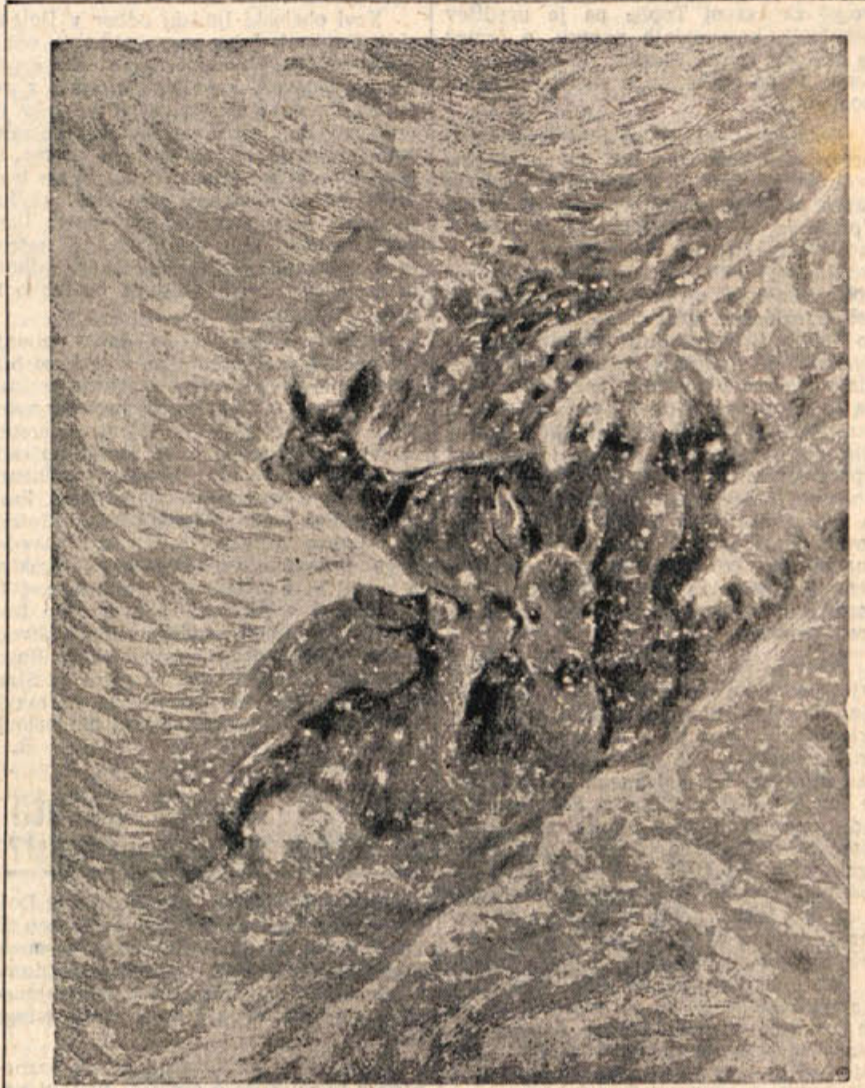
Huda zima je velik sevražnik divjadi. Pravi lovec bo pomagal svojim varovancem v tem času. Marsikje so postavili krmilne hišice. In pri vas...