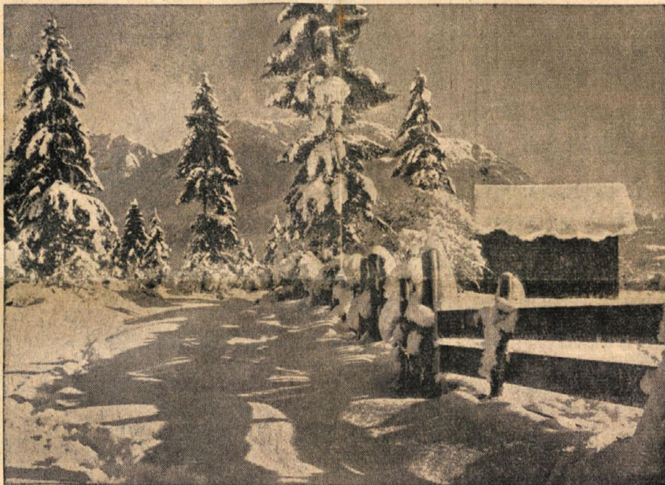
Do dolgo smo čakali, da je doline prekrila tanka plast snega. Na planinah pa je bela odeja tudi dober meter visoka

Med najvažnejšimi nalogami občinskih odborov OF, ki bodo izvoljeni do 15. februarja, bo takojšnja priprava za volitve občinskih ljudskih odborov. To bo nadvse važna naloga naših političnih organizacij. Ne sme nam biti vseeno, kdo bo prišel v bodoči občinski ljudski odbor, kajti od ljudi, ki jih bomo izvolili, bo odvisno, kakšno bo poslovanje občine. Ne smemo podcenjevati podtalne agitacije sovražno razpoloženih ljudi, ki si želijo starih županskih stolčkov in seveda neomejene oblasti za sebe in svojo žlahto. Od budnosti frontnih organizacij in vseh članov je odvisno, ali bodo novi občinski ljudski odbori v polni meri izpolnjevali svojo nalogo nadaljnje demokratizacije in socializacije na vasi, ali pa bodo postali zbirališče starih stremuhov in ocklja naprednejšega gospodarstva v škodo vseh ljudi.