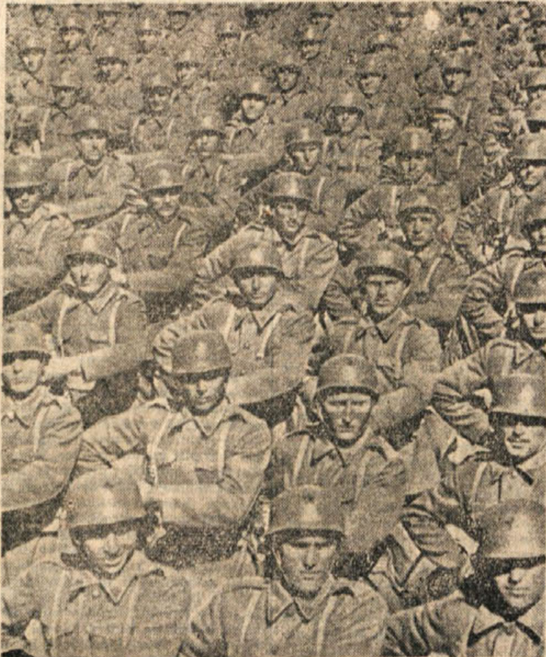
Pešadijske enote JA na lanski prvomajski proslavi v Beogradu

nenehno pomnoževali. Med odločilnimi bitkami v Stalingradu in El Alameinu so naše enote vezale na Balkan 36 nacifa-