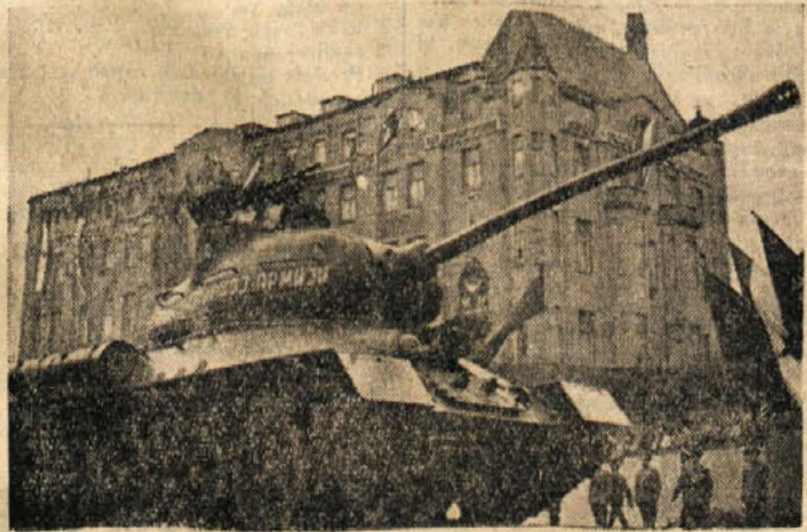
Tankisti v defileju