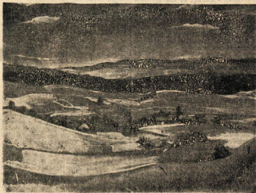
Božidar Jakac: »Dolenjska pokrajina«, pastel 1931

Neposredno pred napadom na samo nemško postojanko na Bučki je bil Janko član bombaške trojke, ki je imela nalogo vdreti in župnišče, v katerega I. nadstropju je bila nemška posadka, in pritrilnih kletah pa zaprtih nekaj domačinov. Trojka je že vdrla v vežo, ko je nenaden ropot opozoril nemško stražo in v snopu krogel, ki jih je iz-