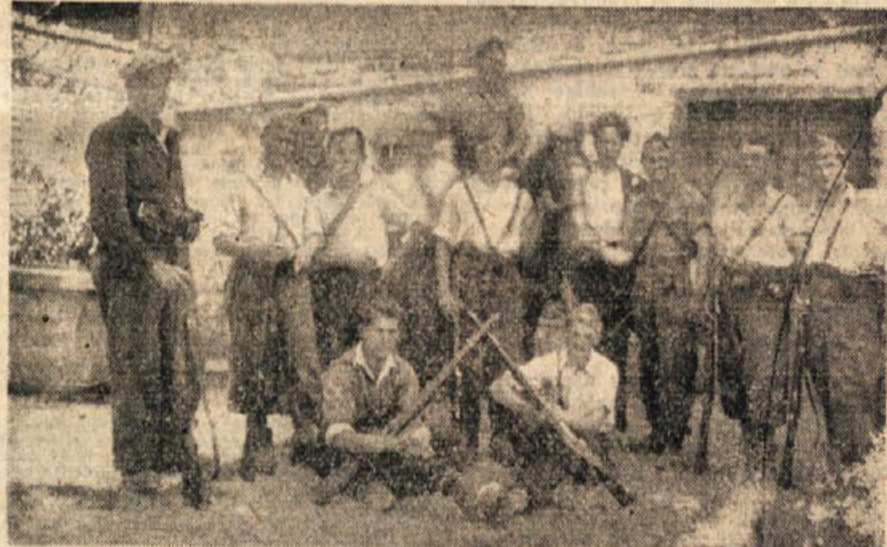
Revolucionarna armada in nova ljudska oblast sta rastle med borbo vzporedno. — Na sliki: skupina partizanov Kolijskega odreda s člani rajonskega odbora Stari trg ob Kolpi (fotografirano v maju 1942. leta v Zagorcu)

Naj živi naš vrhovni komandant — ustvaritelj naše Armade — maršal Tito!