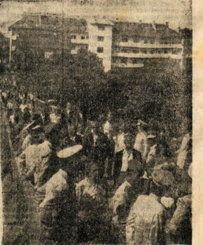
Novomeška garnizija JA je letos ob Dnevu vstaje podarila mestu nov most v Ragov log