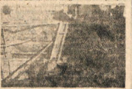
V Dobindolu betonirajo vaški vodnjak

Med številnimi, letos elektrificiranimi vasi v novomeškem okraju so tudi Uršna sela, Dobindol in okoliške vasi. Skozi vse leto so prebivalci tamošnjih vasi s prostovoljnimi delom pripravljali drogove, kopali jame in pomagali pri gradnji transformatorja. Najbolj pridni so bili Dobindolci, ki so pomagali povsod, kjer je bilo treba. Prizadevanje vaščanov je podprl okrajni ljudski odbor, strokovna dela pa so izvršili uslužbenci DES in Mestnega elektro-podjet-