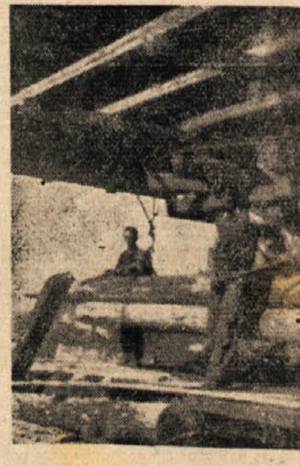
Mojster Podgornik na delu (končna postaja železnice v Strži)

Predčšana izpolnitev letne obvezne sečnje in spravila lesa, prispevajo tekmovalno za večjo storilnost in kvalitetno obdelavo ter veliki kresovi, ki so jih prižigali delavci na vrhovih Roza in Brezove rebri ter drugih sečiščih na predvečer praznika Republike so dokaz, da se sekači, vozniki in soferji Lesno-industrijskega podjetja Novo mesto zavedajo pomena državnega praznika 29. novembra.