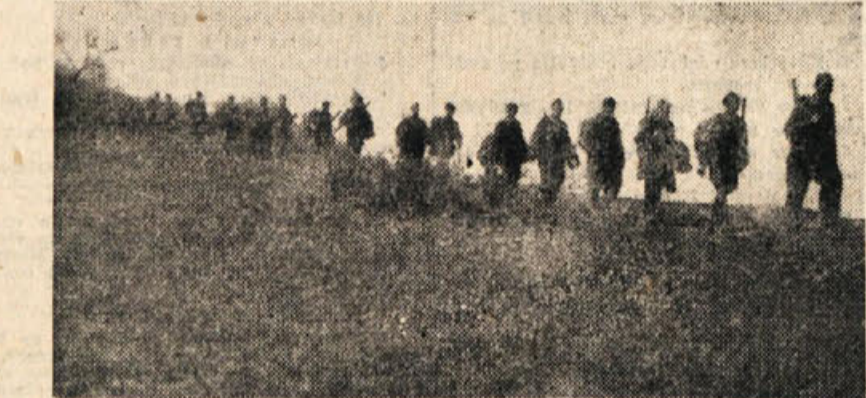
Partizani na pohodu

pojavi Italijani, ker so zvedeli, da se tam zbirajo partizani. Vedel hudega enežnega meteža, ki je sproti zavejal gazi, niso našli poti za partizani in so se brez uspeha vrnili v Semeč.