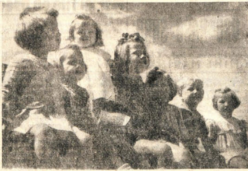
Kdo bi ne bil vesel takih zdravih, mladih korenjakov? V življenju se gotovo ne bodo ustrašili nobenih težav.

fonda smo za to pomoč vse premalo hvaležni. Premalo mislimo na to, da je pomoč prihajala k nam ravno ob času, ko smo imeli največje težave v prehrani in v našem socialističnem gospodarstvu sploh, najprej zaradi dobro poznane sovražne informbirojevske politike, potem