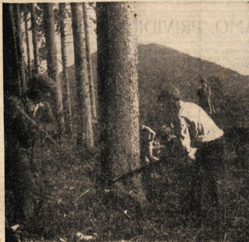
Gozdovi so naše veliko narodno bogastvo. Ali dovolj skrbimo zanjet

Frontovci kočevskega okraja so podarili za zgraditev kulturnega doma Slovencev v Trstu 72.000 din. Zbiranje denarnih prispevkov se nadaljuje.