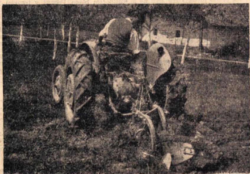
Kmetije so težko čakali, kdaj se bo vreme obrnilo. Zda, ko je nastopilo lepo jesensko vreme, je treba pobrati: zemlja čaka in čim prej boš sejal, bolje boš žel.

Predvidene so volitve v vaške odbore OF, ki bodo verjetno že v novembru in decembru, volitve v občinske odbore OF pa bodo po združitvi krajevnih ljudskih odborov. Na vse te vo-