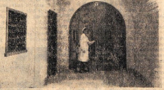
Veža pljučnega oddelka (nove bolnišnice) v Novem mestu

Tuberkuloza (jetika) je med najstrašnejšimi sovražniki človeštva. Borba proti njej mora biti zato skrb vseh državljanov. Navse, ki jih dobijo bolniki in njihove družine v dispanzerju za domače zdravljenje in za zaščito, je treba uresničevati vedno in povsod. Strokovno osebje ne more vsak dan po vsej Dolenski izvajati vseh nalog ter jih nadzirati. Zato pa se obrača Rdeči križ po svoji protituberkulozni sekciji