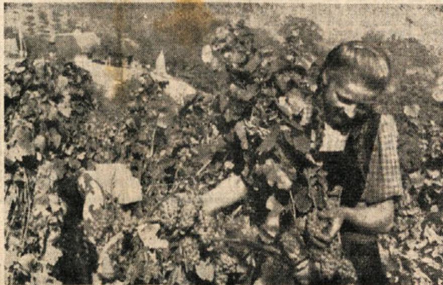
...Ze triček prepeva — ne morem več spat trgatev veleva — spet pojdemo brat...

»Vsako takšno rovarjenje je treba zatirati, ker tisti, ki razvema nacionalno sovraštvo in šovinizem, ni prijatelj