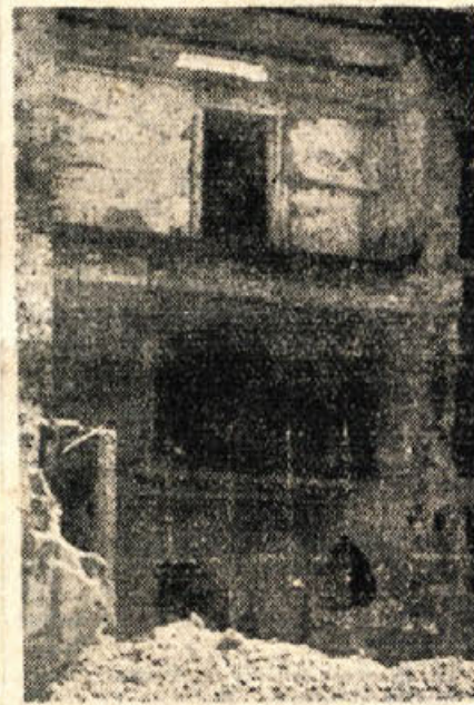
Ruševine Kobetove hiše mestu šest let po končani vojni ne delajo časti

Res ima Novo mesto še nekaj hudo bolečih ran, med njimi Kobetovo hišo na