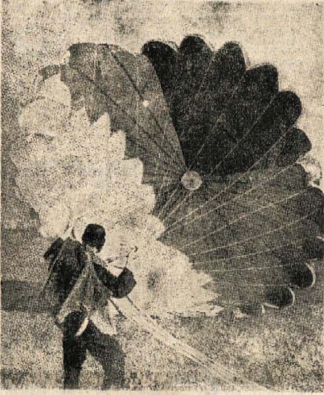
Tako bodo pristajali

Zapišite si: 2. septembra v Prečno na prvi dolenjski množični aeromiting!