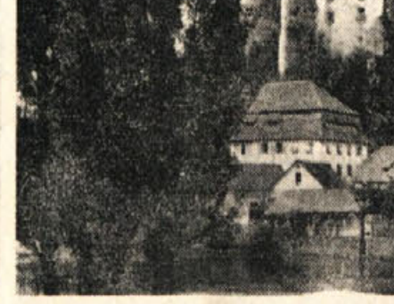
Žužemberki grad pred vojno

Kako izgleda Žužemberk šest let po osvoboditvi? Posledice vojne in neshetih spopadov s sovražniki ljudstva se vidijo v trgu še na vsakem koraku. Nad