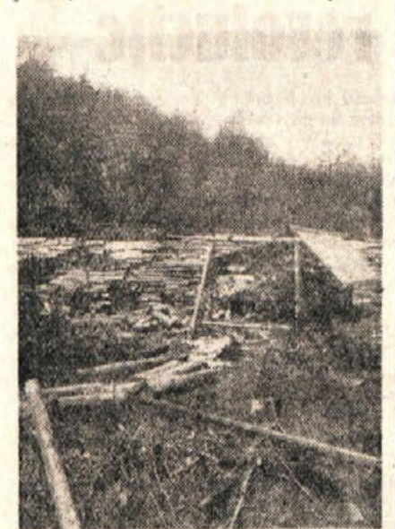
Tisoči kubikov hlodovine čakajo na prevoz z žičnico

vzemnika gradnje in prejšnjega gradbenega odseka podjetja se je gradnja žičnice zavlekla do letošnje spomladi. Precejšen odstotek neodpeljanega lesa gre na račun te zamude pri gradnji žičnice. Podjetje je bilo prisiljeno poklicati na pomoč drugo skupino strokovnjakov, ki so žičnico končno spravili