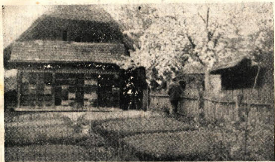
Zalokarjev žebeljak na Vrhu pri St. Jerneju — sedež štaba Zapadno-dolenjskega odreda v avgustu 1942 (2 km od St. Jerneja, belogardiistična postojanka)

Zbirališče 22. julija 1951 ob 9. uri dopoldne pred stavbo Okrajnega ljudskega odbora v Novem mestu, nato odhod proti Trški gori. Stab aktivistov