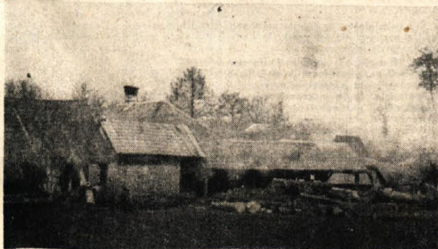
Kulijanova žaga v St. Jerneju — skladišče partizanskega orožja v letu 1941

Med tednom bo ljudstvo v krajih, ekoci katere bo šla Dolenjska partizanska štafeta, spremljalo partizane in jih pogostilo kakor tolikokrat v letih vojne. Od Dobriča do Trebnjega bo spremljalo štafeto 25 konjenikov, od Trebnjega do Sv. Križa se ji bo priključilo 20 konjenikov, do Cateža 10 in do Primskovega 10 konjenikov. Od Primskovega do Kopačice na mej trebanjskega in grosupeljskega okraja bo štafeto spremljalo 40 konjenikov.