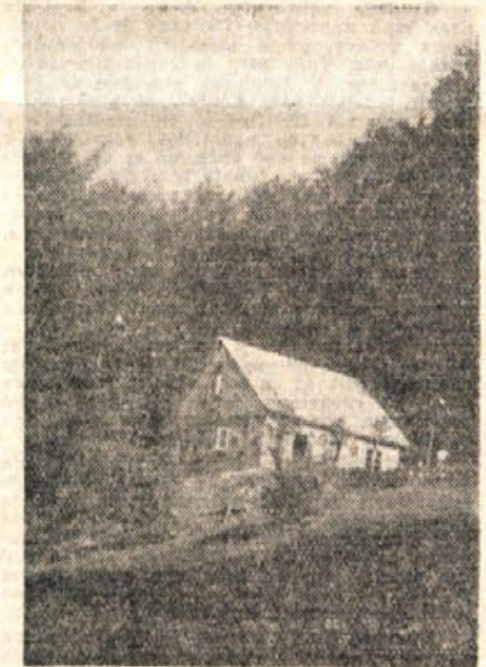
Dom Vinka Paderišča pri Gospodični na Gorjancih

Smola, prav tihi hip me je prijatelj zbudil, čes; Greva naprej, in Trdinov lik je utonil v poletno gorjansko modrino. Pred nami se zeleni Gabreka gora, nad njo pa sije koč pri Gospodični. In se spominjam davne (skoraj) bil zapisal obrabljen frazo) blažene — mladosti, ko sem s knjigo Bajk in povesti strmel z