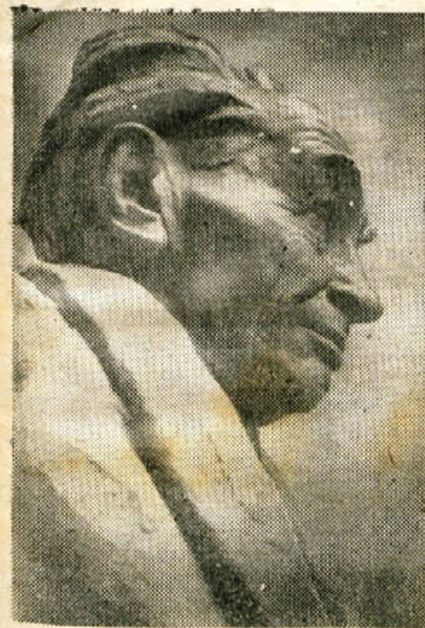
Oton Župančič (Jakob Savinšek)