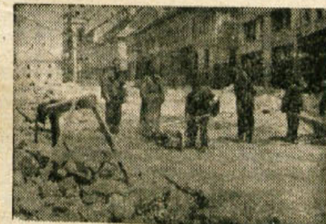
Ekipa kemičarjev čisti »zastrupljeno« ulico

V soboto 21. aprila so enote protiletalske zaščite (PLZ) v Novem mestu preizkusile svoje pripravljenost. Prvi večji javni nastop enot PLZ je potrdil, da imajo njihovi člani odgovorne in težke naloge, saj se v mirnem času pripravljajo, kako bi bilo treba pomagati skupnosti v primeru vojne.