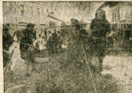
Z dobro voljo gre vse

Tako vprašujejo ljudje, ki opazujejo te dni v Novem mestu razkopane ceste, hribi granitnih kock pa so še vedno ne-načeti. Zdad, ko se je delo razmahnilo, bi seveda vsakdo rad čimprej videl cesto tlakovano. Od 15. februarja, ko so se za-