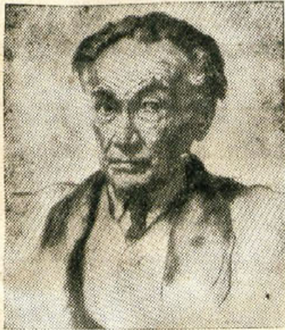
Oton Župančič