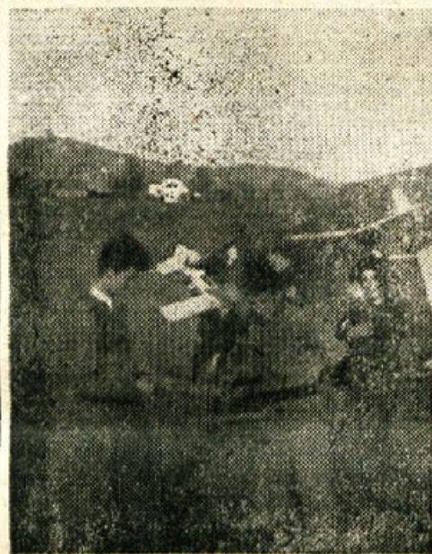
Z nedeljskih tekem novomeških modelarjev

Trdinovega vrha čez Rog na Notranjsko in dalje na Triglav v počastitev 10-letnice ustanovitve OF.