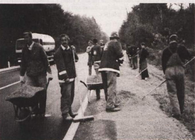
DELO NA CESTI - Na magistralni cesti Jesenice-Obrežje pri odcepu za Krško se konča več kilometrov dolg odsek, na katerem je Cestno podjetje Novo mesto položilo v preteklem obdobju nov asfalt. Tam, kjer so asfaltirali nazadnje, so delavci pred dnevi nasipavali in utrjevali bankine. Pred delom na cesti so postavili več prometnih znakov, s čimer so hoteli opozoriti nase in si zagotoviti kolikor toliko varno delo. Vsem znakom navkljub je glavčina vozil z nezmanjšano hitrostjo drvela mimo skupine delavcev. Na sliki: delavci nasipavajo rob ceste.