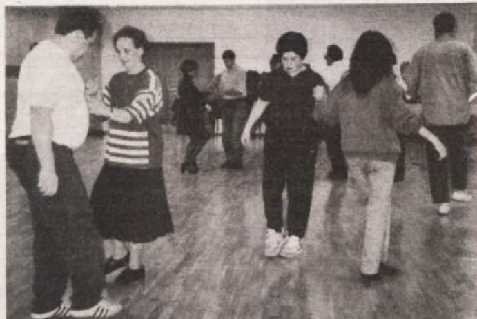
"RADI SE DOBIMO NA MEDNARODNI FOLKLORI" - Pravijo plesalci, ki, če le utegnejo, pridejo vsak terek. Znano je, da sta ples in zabava najstarejši obliki človeškega druženja in da bi bilo brez njiju življenje veliko bolj pušno in prazno. Zato vabljeni še ostali.

• Izum knjigotiska je bil največji dogodek v zgodovini sveta. (Hugo)