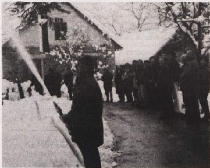
VODA V PLEMBERKU - V soboto je tudi v Plemberk, vasico tik nad vodovodnim zajetjem v Stopičah, odkoder že skoraj 100 let dobiva vodo Novo mesto, pritekla voda.

Plemberk šteje okoli 65 prebivalcev in leži, kot rečeno, tik nad vodovodnim zajetjem. Naselje brez kanalizacije na taki legi pa je vseskozi s stališča varstva tega pomembnega vodnega vira predstavljalo resno grožnjo. Tako je hkrati z vodovodom v Plemberku potekala tudi gradnja kanaliza-