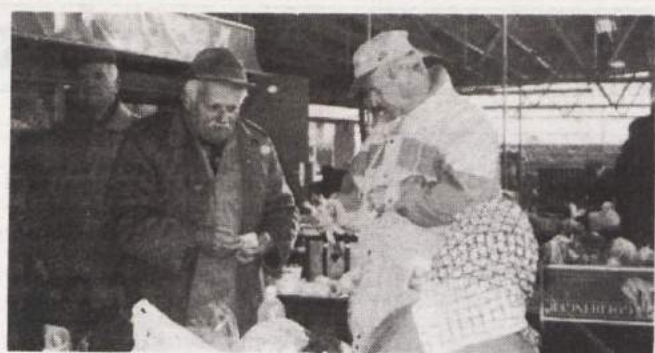
UTESNJENA TRŽNICA - Na tržne dni je novomeška tržnica polna prodajalcev; ki pa pozimi zaradi prepaha zmrzujejo tudi v pokritem delu tržnice.

KOČEVJE - Košarkarji Snežnika so se z visoko zmago v 11. krogu druge lige maščevali Borovnici za poraz v prvem delu. Kočevci so z ostro igro v obrambi onemogočili visoke gostujoče igralce, za nameček pa so tudi zadevali kot za stavo. Zmaga s 24 točkami razlike (88:64) bi bila še višja, če bi bili v zaključku bolj zbrani. MILAN GLAVONJIC