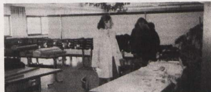
NOVOTEKSOVA TKANINA BLIŽE KUPCEM - V prostorih menze je bila prejšnji konec tedna tradicionalna akcijska prodaja kvalitetnega in modnega metražnega blaga. Čeprav je bilo prvi dan zaradi obilice snega nekaj manj kupcev, so bili v Tkanini s prodajo zadovoljni. Tudi kupci pravijo, da so s takim načinom prodaje zadovoljni, saj blago, razstavljeno na veliki površini in razvrščeno po kakovosti materialov, prej opazijo in se tako lažje odločijo za nakup.