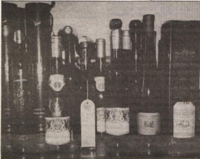
V POSEBNIH STEKLENICAH - Vina posebnih trgovcev so običajno v manjših in lepo opremljenih steklenicah. Suhi jagodni izbor polnijo v 2,5-decilitrski steklenički, saj se tega "naj" vina med vini pridelava najmanj.

DOLENJSKE TOPLICE - Na pustno soboto, to je 17. februarja, bodo v zdravilišču ob 20. uri privedli veselo pustovanje. Izvirne maske bodo imele prost vstop, najboljše pa bodo nagrajene. V krofe bodo "zapekli" nekaj lepih nagrad, med njimi zlat prstan.