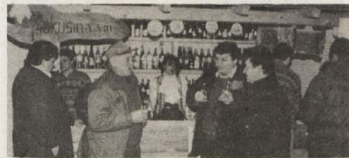
VINSKI PRAZNIK - Na Bizelskem so v soboto izpeljali zaključni del prireditve Praznik bizelskih vin '96. Ocenjevalci, ki so se ravnali po pravilniku radgonskega sejma, so podelili Vinu Brežice veliko zlato medaljo za najodličnejši izbor laškega rinzlinga. V oceno so prešli skupno 272 vzorcev in le nekaj od teh so jih jih zavrnili, kar po prepričanju organizatorjev pomeni, da so vinogradniki in kletarji na Bizelskem kos svojemu poslu. V okviru vinskega praznika so organizirali poleg ocenjevanja strokovna predavanja. Vina, ki so jih ocenjevali, so obiskovalci prireditev v soboto lahko pokušali, kar kaže tudi posnetek, ki je nastal v družbenem domu.