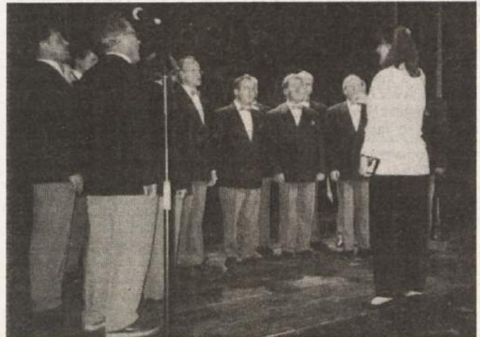
KONCERT LJUBITELJSKIH SKUPIN - Na predvečer državnega praznika je bila v Šeškovem domu v Kočevju osrednja prireditev ob slovenskem kulturnem prazniku. Na koncertu ljubiteljskih skupin, kot so prireditev poimenovali, so nastopili: moški pevski zbor Svoboda iz Kočevja, pevška skupina pri društvu upokojencev Kočevje, folklorna skupina Kostel, učenci glasbene šole Kočevje ter dijaki kočevske gimnazije. Koncert je bil prvi iz cele vrste različnih prireditev, ki so jih v Kočevju pripravili v počastitev kulturnega praznika. Tako kot so se začele, pa se bodo s koncertom tudi zaključile, in sicer 24. februarja, ko bo v Šeškovem domu nastopil mešani zbor Viva iz Brežic.

* Letos bodo poleg stalnih projektov, kot so pripravljane strokovnih podlag, likovne delavnice in informiranje javnosti, sodelovali pri pripravi posebne številke revije Proteus. S pomočjo sponzorjev, ki so edini vir financiranja društva, nameravajo obnoviti cerkvico sv. Vida v Lazih ob Kolpi, celoten program del v letu 1996/97 pa bo dokončno znan šele spomladi, ko ga bodo sprejeli člani društva.