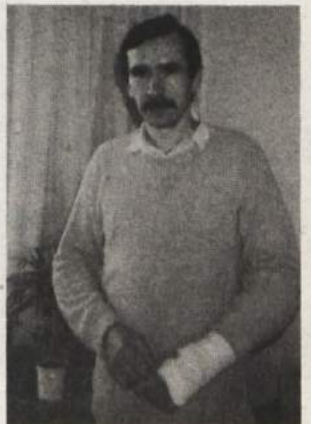
OČITKI PODKREPLJENI S KUHINJSKIM NOŽEM - Mira je z nožem napadla njegova sestra in mu poškodovala roko.

življenje je pač med brata in sestro postavilo zid. Z zadevo se bo očitno soočilo tudi sodišče. J. KOVAČ