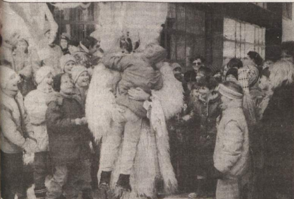
KURENTI V PRIČAKOVANJU POMLADI - Nič ne kaže, da je ptujskim kurentom, ki so v petek z zvonce odganjali zimo in klicali pomlad po novomeških ulicah, to tudi uspelo. Komunalci in cestarji bi bili veseli, če bi jim zvonjenje pomagalo s cest in pločnikov spraviti vsaj sneg in led, najbrž pa bo to naredila šele odjuga. Kurenti so svoj namen dosegli, saj so vso širno Slovenijo v teh dneh tako povabili na svoje kurentovanje.