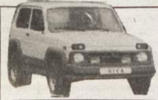
LADA NIVA 1.7 i - nov model

— LADA KARAVAN 1500 že od 952.000,00 SIT — LADA SAMARA že od 999.000,00 SIT — LADA NIVA že od 1.338.000,00 SIT