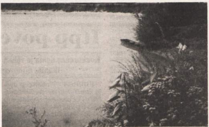
NEKDANJA GRAMOZNICA POSTAJA PRIVLAČNA - Brežiška Forma si prizadeva, da bi jezero, nastalo v opuščeni gramoznici pri Borštu med Krško vasio in Cerkljami, uredila privlačno turistično točko v Posavju. Še zlasti pridejo na svoj račun ljubitelji ribolova, saj je jezero bogato s postrvmi. To so ribiči dokazali tudi na nedavnem tekmovanju.

BIZELJSKO - V telovadnici osnovne šole Bizeljsko bo jutri, v petek, ob 16. uri 5. Zimski festival. Na tej glasbeni prireditvi bo nastopilo 18 pevcev solistov.