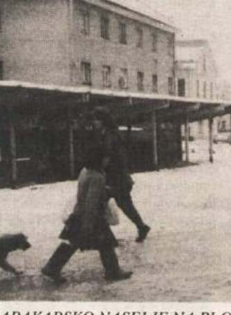
BARAKARSKO NASELJE NA PLOŠČADI - Enajsti dan novega leta je zaradi stojnic, ki sta jih v času med božičnimi in novoletnimi prazniki postavila na mestni ploščadi v Kočevju dva kočevska podjetnika, bilo strogo središče mesta videti kot opuščeno barakarsko naselje. K temu videzu so prispevale deske, iz katerih so bile zbite stojnice, saj je bil na njih še dobro viden z ničimer prikriti omet. Po mnenju občanov Kočevja, ki so se nad stojnicami zgražali, kritika ne gre le obema podjetnikoma, ki sta stojnice za točenje pijače in nudenje hrane na prostem postavila z vsemi potrebnimi soglasji in dovoljenji, marveč tudi občini, upravni enoti in inšpekcijskim službam, ki so dovoljenja izdali, ne da bi zahtevali, kakšna mora biti podoba stojnic.

KOČEVJE - Zaradi sedanjega odlagališča komunalnih odpadkov imajo prebivalci Mozlja, Livolda in še drugi vrsto pripomb, zato je sedaj v prostorih občine Kočevje javno razgrnjen osnutek novega ureditvenega načrta za novo odlagališče. Občani imajo do 12. februarja možnost, da podajo svoje predloge in pripombe. V tem času bo Oddelek za okolje Občine Kočevje organiziral javno obravnavo v KS Ivan Omerza s sedežem v Livoldu. Osnutek je izdelalo Populis, Podjetje za prostorski inženiring, d.d., Ljubljana.