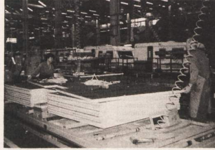
BODO DOLGOVI POPLAČANI? - Skupna začetna stečajna bilanca Adrie Caravan v stečaju je 3,4 milijarde tolarjev, od tega 85 odstotkov predstavljajo osnovna sredstva. Na nepremičninah (zgradbah in zemljiščih) je, kot smo že omenili, vpisana hipoteka Sklada RS za razvoj. Na kakšno poplačilo lahko računajo upniki, ki svojih terjatev nimajo zavarovanih s hipoteko nad premoženjem podjetja v stečaju, bo odvisno tudi od dogovora z Adrio Mobil, ki nadaljuje proizvodnjo prikolic (na sliki), ter od uspešnosti prodaje premoženja, opreme in zalog.