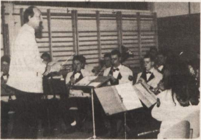
LONGSTREET - DIXIE - Pihalni orkestri že lep čas na koncertih ne nastopajo več s koračnicami ali poskočnimi polkami za ples, kar se nekdanje počele godbe, njihove predhodnice. To je morda posledica ali pa tudi razlog, da so njihove vrste zapolnjene z mladimi silami, ki se učijo igranja v glasbenih šolah. Na sliki je nastop Gasilske godbe na pihala Loče.