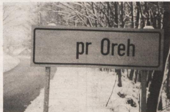
PR OREH - Pobalinsko pacanje po tablah z imeni krajev in smerokazih je očitno priljubljena zabava primitivcev. Tistega, ki je Hrib pri Orehu (kraj v stopiški fari v gorjanskem Podgorju) z "retuširanjem" preimenoval v "pr Oreh", bi morali domačini v mrzlem zimskem dnevu k "tejmu oreh" privzeti, ga sleči in mu "po rit" s šibo napisati, da se to ne sme početi. In to nekajkrat ponoviti, da se bo ja, bik hamlasti, zapomnil, kaj je narobe naredil. Samo da ne bomo potem drugič brali "pri Orehu".

• Otroci so se prej naveličali metati petarde kot opozicija s Hvalico in Pregljem na čelu.