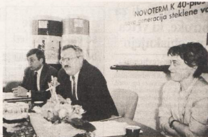
PREDSTAVITEV NOVEGA PROIZVODA - Novo generacijo steklene volne Novoterm K 40 plus so vodilni tovarne Krka Novoterm, ki je v večinski lasti nemškega koncerna Fleiderer, predstavili na novinarski konferenci prejšnji četrtek.