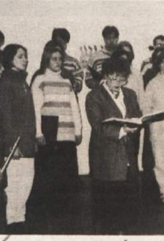
RAZSTAVA DEL DRUGAČNIH - V petek, 19. januarja, ob 18. uri so v Miklovi hiši v Ribnici odprli razstavo izdelkov stanovalcev Doma Škofljica. Z razstavo predmetov iz stekla in žgane gline, ki so jih naredili dušeno in telesno prizadeti gojenci, so delavci Doma Škofljica ribniškemu občinstvu pokazali ustvarjalnost drugačnih. Ob otvoritvi razstave, ki bo v Ribnici na ogled še do jutri, 26. januarja, je nastopila tudi skupina Stopinje in zapela nekaj znanih slovenskih ljudskih in drugih pesmi.