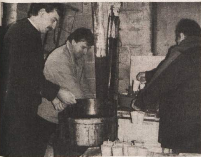
NA SINJEM VRHU KUHAJO PTIČJE POGAČE - Turistično društvo Sinji Vrh je decembra lani pričelo akcijo "Ptički ne bodo lačni". Odločili so se, da bodo pripravili več tisoč ptičjih pogač ter jih ponudili v prodajo predvsem šolam v Ljubljani in okolici, na Dolenjskem in v Beli krajini. Pogače kuhajo v stari kuhinji (na fotografiji), po dobrem mesecu pa ugotavljajo, da je bil odziv na njihovo akcijo veliko večji med ljubljanci kot med Dolenjci in Belokranjci. Hkrati je turistično društvo naslovilo na ministrstvo za okolje in prostor pobudo, naj bi bilo letos slovensko leto varstva ptic.

ZA MALICO - D. N. iz Trebnjega je utemeljeno osumljena, da je v času od 5. do 16. januarja v trgovini Mercator Gradišče v Trebnjem ukradla vakuumsko pakiran kraški pršut, hrenovke in zavoj cigaret. Trgovino je oškodovala za 6 tisočakov.