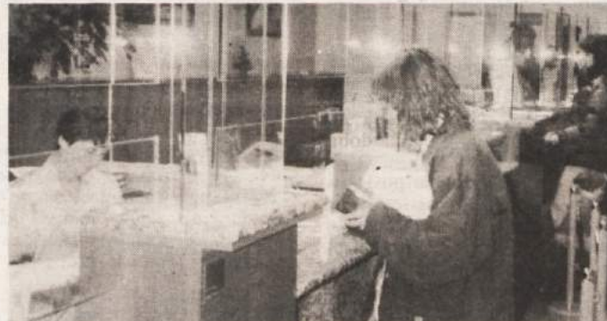
27 MILIJONOV TOLARJEV ZA IVANŠKO POŠTO - Ivančani se poleg nove občine, zdaj lahko vesele še sodobnejše, temeljito prenovljene pošte. Takšna pošta s telefonskimi govornicami se napolnila tudi spodbodi občinskemu središču. Z 27 milijonov tolarjev vredno naložbo pa so lahko zadovoljne tudi uslužbenke, ki se v službo pretežno vozijo iz sosednje trebanjske občine, saj so tudi očem strank skriti prostori dobili novo podobo.