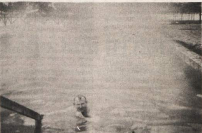
ZIMSKI KOPAČ - V Šmarjeških Toplicah uradno sicer še nimajo odprtega zimskega bazena, vendar si tisti, ki razmere bolj poznajo, radi privoščijo zimsko plavanje v starem, verno in lepo obnovljenem lesenem bazenu, ki leži tik nad vrelcem. V bazenu je celo zimo voda, kar domačini dobro vedo. Možak na sliki že dolgo živi v Beli krajini, a je po rodu iz teh krajev in rad pozimi v spomin na otroška leta zaplava v "domačem" bazenu, ko drevje okoli oklepa izvje.

DVOR - Danes, 25. januarja bodo na seji občinske skupščine odločali o ustanovitvi nove krajevne skupnosti Dvor. Ker so se prebivalci enajstih vasi in dveh zaselkov v javnomnenjski anketi 92-odstotno odločili za ustanovitev omenjene krajevne skupnosti, približno enak rezultat pa je bil dosežen tudi na zboru krajanov, je upravičeno upati, da bodo svetniki novomeške občine upoštevali ljudsko voljo in potrdili novo krajevno skupnost Dvor.