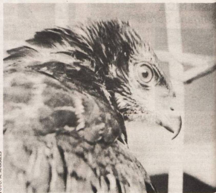
Kralj nebesnih širjav v ujetništvu v ljubljanskem živalskem vrtu.

Kljub temu da je planinski orel z zakonom popolnoma zavarovan, so oko-