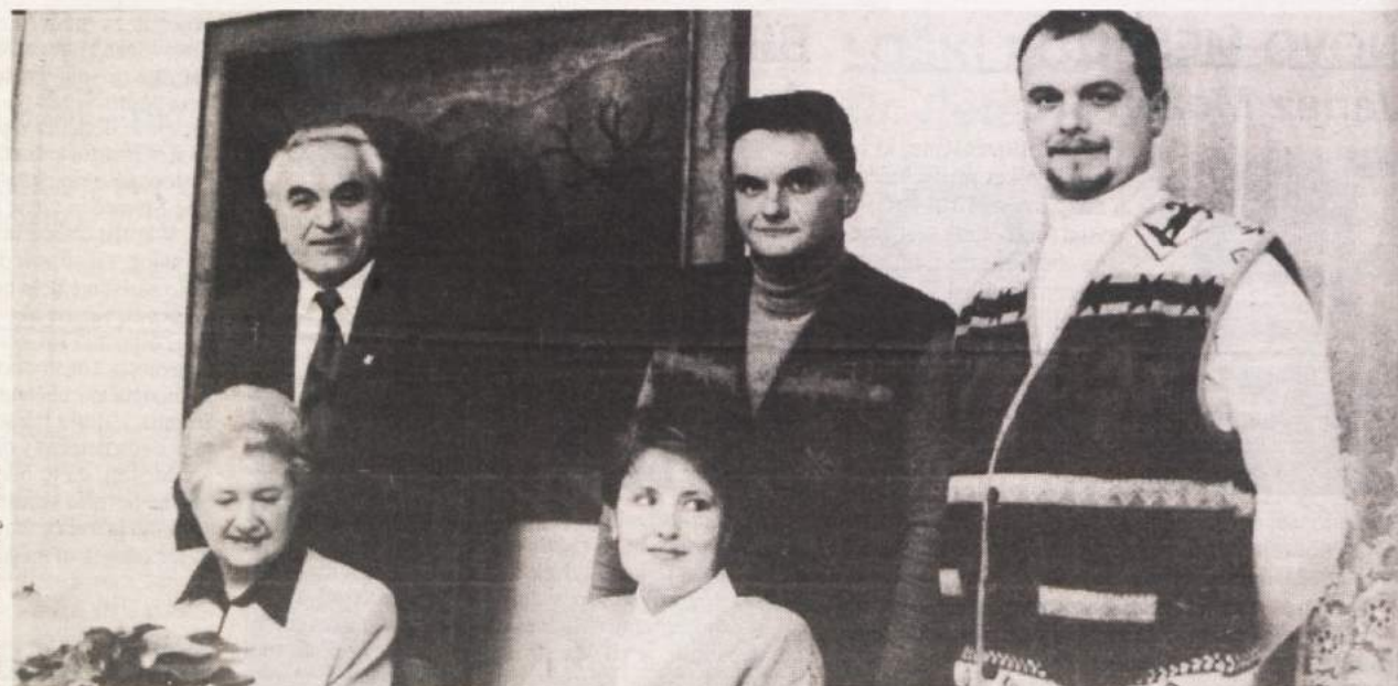
V podjetje se vključuje tudi mlajša generacija: sinova in snaha.

"Še dve stvari sta, o katerih smo pred leti še samo sanjali, zdaj pa jih že uresničujemo. Oba z ženo sva posebej občutljiva do narave, zato se nama zdi, da je treba njeno uničevanje zaustaviti. Od nekdaj sem se vpraševal, kaj napraviti z odpadnimi vodami, a ko so v tujini tehnično dorekli stvari in začeli uporabljati manjše čistilne naprave, sem stopil v stik z nekaj avstrijskimi podjetji s tega področja in tako je nastala mešana družba SWR Beton Slovenija. Za zdaj poskušamo po čim ugodnejših cenah uvažati opremo za čiščenje odpadnih voda iz Avstrije, v načrtu imamo gradnjo tovarne za izdelavo bioloških čistilnih naprav ter lovilcev olj in maščob, skupaj z nekaterimi strokovnjaki pa