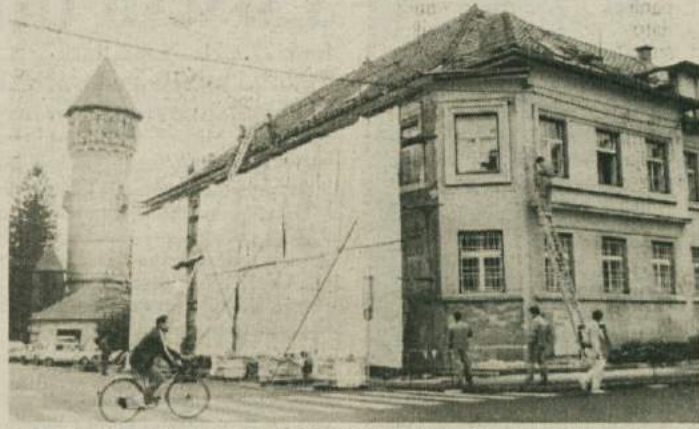
KONČNO NEKAJ LEPEGA O OBČINI - Brežiško občinsko stavbo v teh dneh pospešeno prenavljajo in treba je reči, da je bila prenove na zunaj res že potrebna. Medtem ko je staro mestno jedro v zadnjih letih oživljalo in so mestne hiše dobivale sveže barve, je občinska stavba strašila ob sedanji glavni vpadnici v mesto. Kot je videti na sliki, jo bodo prenovili od temeljev do strehe. Čeprav bodo v občinski stavbi po novem predvse državne službe, bo stavba še naprej občinska in tako tudi najemna stanja.

BREŽICE - V okviru praznovanja ob 90-letnici brežiškega Sokola pripravlja TVD Sokol Brežice kvalifikacijsko tekmo v športni gimnastiki za deklice in dečke. Tako imenovani Hollyjev memorijal, letos 23. po vrsti, se bo pričel to soboto ob 10. uriv športni dvorani gimnazije za dečke in ob 14. uri za deklice.