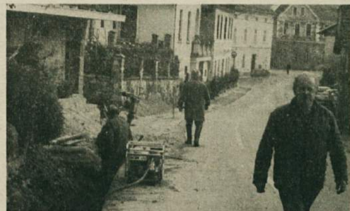
CEVI V MOKRONOGU NE BODO VEČ POKALE? - V starem trškem jedru Mokronogu so bile doslej dokaj pogoste okvare vodovoda, ker so cevi pokale. Prejšnji in ta teden so delavci trebanjske Komunalne zamenjali še zadnje cevi vodovoda od gostilne Deu proti križišču z bencinsko črpalko Petrola, s cevmi večjega preseka, ki zdržijo tudi večji pritisk. Komunalci zatrjujejo, da Mokronočanom posledje ne bi smelo več občasno primanjkovati vode zaradi tovrstnih okvar.

TREBNJE - Tukajšnji občinski odbor SKD je dal pobudo, da bi zbrali nekaj denarja za humanitarne namene, natančno za cisterno GD Trebnje, z organizacijo turnirja v malem nogometu. Turnir bo v sredo, 30. novembra, ob 15. uri v trebanjski telodavnici, pomerile pa se bodo ekipe SKD, SLS, SDSS, TV Slovenija in Mladine.