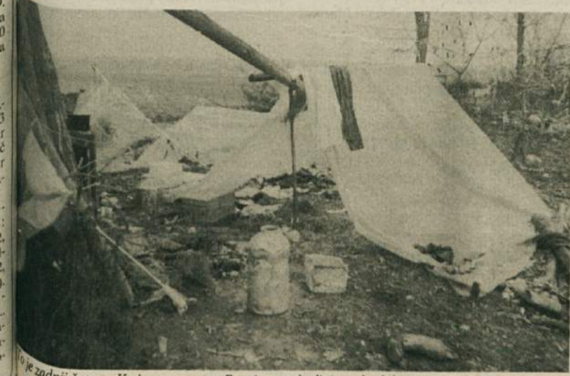
Na zadnji šotor v Kerinovem grmu. Romi se poslavljajo od takih prebivališč.