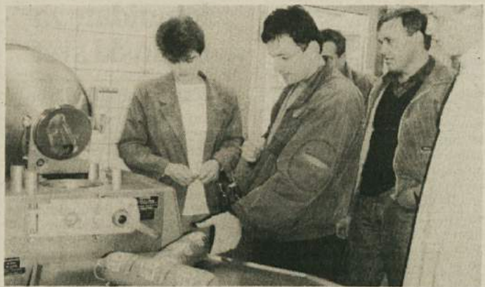
V METLIŠKI KLAVNICI TUDI PREDELAVA - Gostje so si ob otvoritvi predelave mesa v metliški klavnici lahko natančno ogledali, kako nastajajo poltrajni, barjeni in prekajeni mesni izdelki. Seveda pa so jih tudi poskusili, saj je redna proizvodnja že stekla.

Leska dobro uspeva v obliki grma s 3 do 5 ogrodnimi vejami, podobno, kot raste divja leska prosto v naravi. Sadilne razdalje so odvisne od bujnosti sorte, lege in naklona zemljišča, predvsem pa od gojitvene oblike in rodovitnosti tal. Običajna razdalja 5 do 6 m x 4 do 5 m zahteva 333 grmov na hektar. Rigoliranje mora biti temeljito, prav tako tudi zalozno gnojenje, zlasti pa oskrba nasadov, ki ne prenašajo polovicarstva. Lešnikar lahko uniči ves trud, če se mu ne znajo učinkovito postaviti po robu, to lahko vidimo pri ljubiteljskem pridelovanju po vrhovih. Skratka: sodobno plantažno pridelovanje, ki se je tako uveljavilo zlasti v sosednji Italiji, zahteva veliko vlaganja, strokovnega znanja in truda, za vse to pa daje tudi dobro plačilo. Lupinasto sadje dosega daleč največjo ceno na trgu, povpraševanje po njem pa se stalno povečuje. Slovenija pridelala komaj desetino toliko lešnikov, kot jih potrebuje. Inž. M. L.