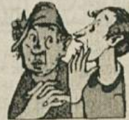
Ena gospa je rekla, da nam ni rešitve. Za kateregakoli župana od šestih bomo volili, bo narobe. Če ne verjamete, vprašajte ostalih pet.

REKLAMA - Stranke in županski kandidati sedaj delajo marsikaj, kar jim sicer niti na misel ne pride, da bi se v predvolilnem času pokazali kot edini in najbolj primerni. Seveda jim je veliko do tega, da bi se ta njihova lepa in sploh in oh dela prikazala v časopisih, na radiu in televiziji. Ljudje so od teh lepih in dobrih del, predvsem pa od obljub že tako iz sebe, da bi na županskem mestu najraje videli kar vseh šest kandidatov hkrati. Takšen šestglavi župan oz. županski šestumrtvir bi gotovo v našo občino prinesel dokončno in večno blaginjo.