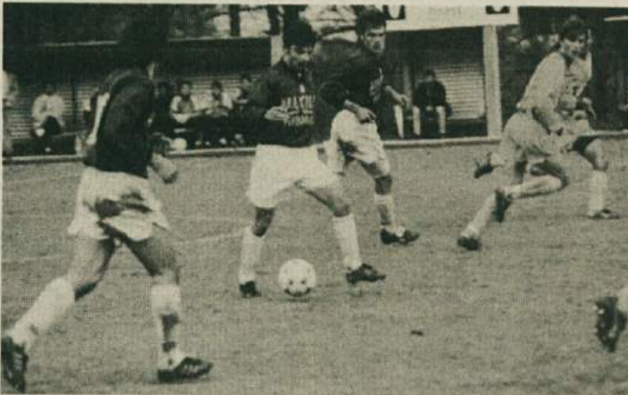
GAJ LETOS NI RAZOČARAL - Nogometaši kočevskega Gaja so se uvrstili v prvo slovensko ligo ravno v sezoni, ko se bo ta zmanjšala za 6 moštev, tako da je boj za obstanek še posebej hud. Ker ni bilo denarja, moštva niso bistveno okrepili, zato je 11 točk, kolikor so jih zbrali, lep dosežek, ki jim ob uspešnem nadaljevanju prvenstva spomladi še daje možnost za uvrstitev med najboljšo deseterico.