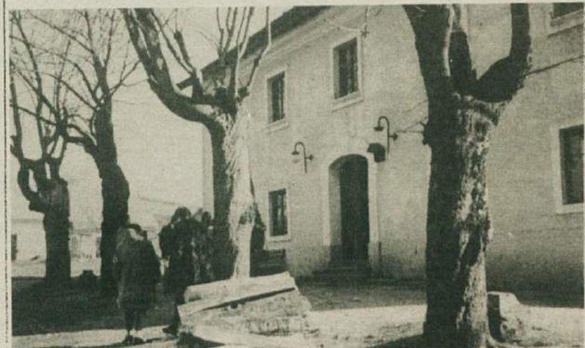
Baragova rojstna hiša