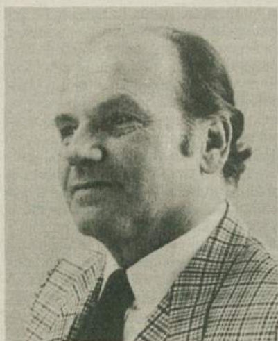
Dr. Jože Pučnik

"Tudi po svetu ima socialdemokracija v svojo aktivnost vključeno problematiko zaščite okolja. Seveda gre tu za specifičen in nekoliko drugačen pogled, kot je to na primer pri stranki zelenih, ki jemlje problem bolj fundamentalistično. Mi pristopamo k temu empirično. Naša teza - o tem sem pisal