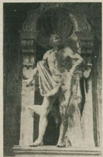
FRESKE PROPADAJO - V lanskem letu so stopnišče v Posavskem muzeju zaprli s steklom, da bi preprečili propadanje baročnih poslikav. Naložba je stala 1,6 milijona tolarjev, krivec za strošek pa je po vsej verjetnosti onesnažen zrak. V naslednjih letih bo republiški restauracijski center natančno spremljal dogajanja na freskah in se na osnovi zbranih podatkov odločil, kako jih bo zaščutil.