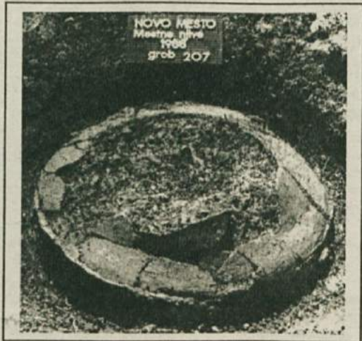
Žarni grob s trebušasto žaro z Mestnih njiv