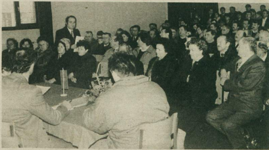
NEZADOVOLJNI KMETJE — Tudi šentjernejski kmetje so nezadovoljni z vlado in trdijo, da kmetijstvo peha v pogubo

Po dolgem času se obeta lep, sončen in topel konec tedna.