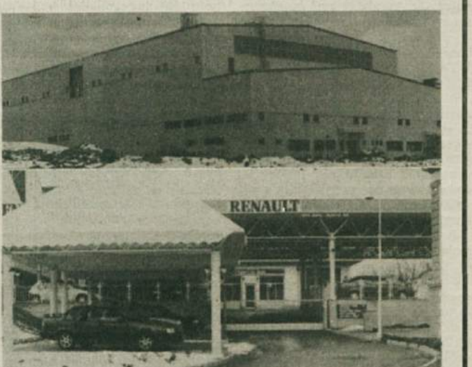
POCENI ČRNE GRADNJE - Povprečno je kazen za vsako od teh dveh Revozovih črnih gradenj gradbenice veljala po 1.000 tolarjev. Skupna tlorisna površina črnih gradenj znaša 8.077 kvadratnih metrov, se pravi, da je kazen za 1 m 2 tlorisne površine črne gradnje 0,2476166 tolarja.

Da ne gre za gradnjo kakšne kurnice ali manjšega prizidka (pa tudi za to mora imeti navaden občan vsa potrebna dovoljenja), naj povedo mere. Pri gradnji pralnice in skladišča gre za objekt velikosti 10 x 22 m, z zunanjo ureditvijo in parkirnim prostorom pa vsa stvar ob Zagrebški cesti meri 47 x 11 m. Pri gradnji lakirnice pa je bil tloris gradbene jame kar 180 x 42 m. Tako bi se po velikosti ti Revozovi črni gradnji uvrstili med največje v Sloveniji.